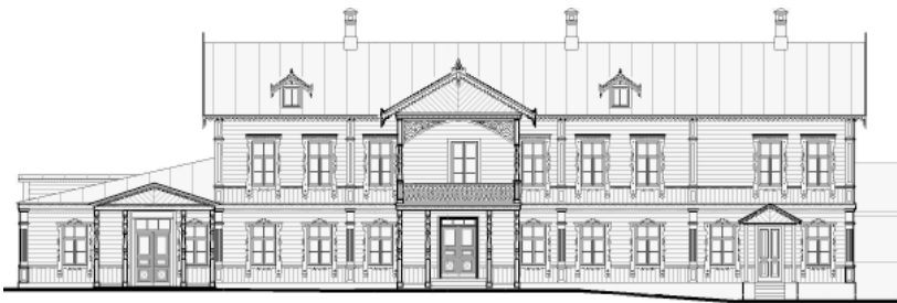
Проект реставрації будинку Крістера. Головний фасад. 2011 р.

Відомостей про садівництво Крістерів, що розташовувалося на північній околиці Києва – Пріорці, в літературі й архівних документах також збереглося небагато. Умовно їх можна розділити на 3 групи. До першої відносяться декілька дореволюційних видань, присвячені, здебільшого, професійній діяльності власників садівництва [3]. Другу групу складають газетні статті й публікації в періодичних виданнях останніх років краєзнавців, що цікавилися родиною Крістерів [4]. Найбільш цінними джерелами є документи Державного архіву