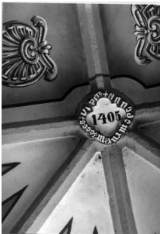
Замковий камінь із датою – 1406 рік

У плані колишній костюль однонавовий, із виділеним пресбітеріумом. Вежа із заходу добудована у 1817–1824 роках [2], великий об'єм із півдня ще пізніше – у першій половині XX ст. [3]. Вигляд храму після зведення дзвіниці можна бачити на малюнку, зробленому в 1875 р. Т. Легоцьким [4]. Нава прямокутна, зі співвідношенням сторін у плані 2:3. Пресбітеріум складається з чотирьох травей, три з них прямокутні, одна – східна – має 4 грані. Завдяки такому плану на головній просторовій осі пресбітеріуму знаходиться простінок, а не вікно. Цей прийом є характерним для пізньої готики. У Великих Берегах маємо найбільш ранній зі збережених на території України храмів із таким закінченням східної частини. Пізніше, в XVI–XVII ст., цей елемент зазнав певного поширення в Галичині та на Волині, ілюстрацією чого можуть слугувати костюли францисканців у Кременці та Шумську, домініканський і фарний костюли в Мостиськах, храм у Новосілці (всі датовані першою половиною XVII ст.).