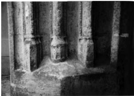
Фрагмент північного portalу костюлу у Береговому

Як справедливо зазначають дослідники, писаним правилам передували правила неписані, звичаєві. І часто цехові статuti й інші документи лише фіксують на папері давно усталені звичаї, а не створюють нову ситуацію. Тому можна думати, що такий «розподіл» був лише констатацією давно існуючого стану речей. Тож, для українського Закарпаття був також актуальний вплив Відня. Цікаво, що в готичній архітектурі Словаччини, що теж входила територіально