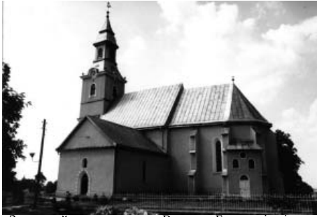
Загальний вигляд храму у Великих Берегах із півдня

У 1427 р. м. Берег отримав Георгій Бранкович [1]. На початку XVI ст. адміністративний центр комітату було перенесено до Лампрехтгази, яка після цього стала називатися Бергесасом.