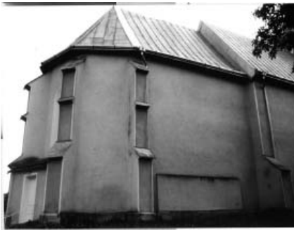
Північний фасад пресбітеріуму

Останньою роботою М. Хнаба вважається нава костюлу Марія ам Гештаде. Тут він зводив навовий корпус. Саме під час будівництва цього костюлу