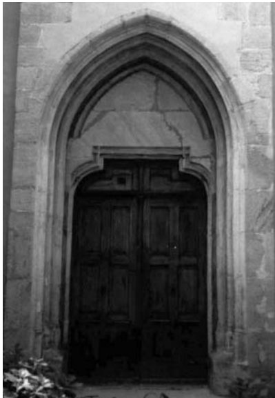
Північний портал костюлу у Береговому

цехів. Цікаво, що за віденським, окрім території Австрії, закріплювалася територія всього Угорського королівства [13].