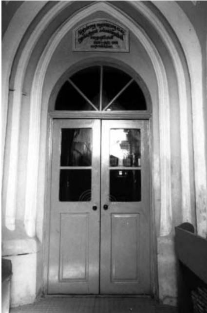
Західний портал костюлу у Великих Берегах

лися до 1846 р. на кошти, виділені графом Шьонборном [10]. Цікаво, що це ледве чи не перша неготична перебудова середньовічного храму на території України. Загальна побудова симетричного фасаду, деталі, елементи композиції мас мають ще всі ознаки пізнього класицизму.