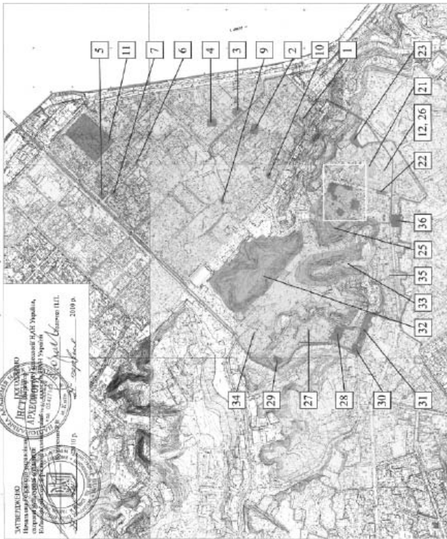
Схема розміщення археологічних об'єктів