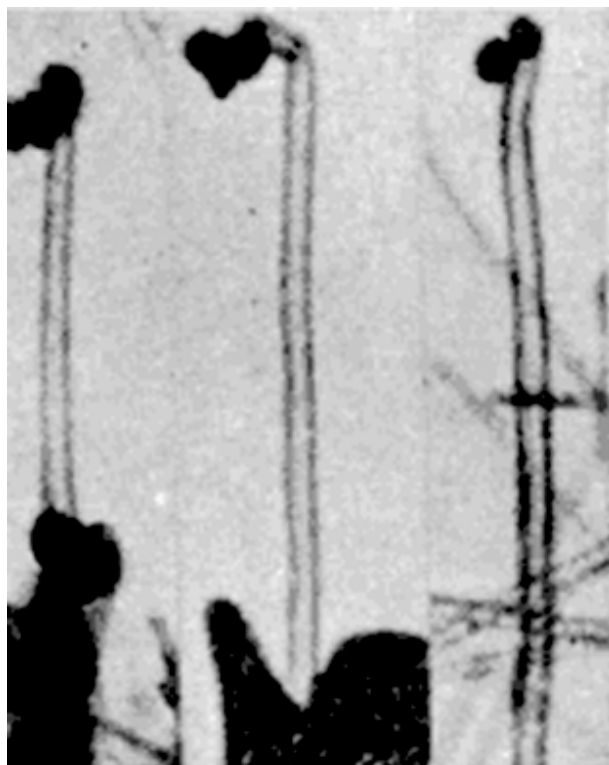
Рис. 2. Электронномикроскопические снимки УНТ из работы [17].

талл, своим основанием расположенный на крупинке железа, из которой он вырос, и имеющий на конце избыток железа, перенесенного вперед в процессе роста... Сами частицы почти прозрачны для электронов... Создается впечатление, что внутри частицы проходит канал и что сама частица является пустотелой”.