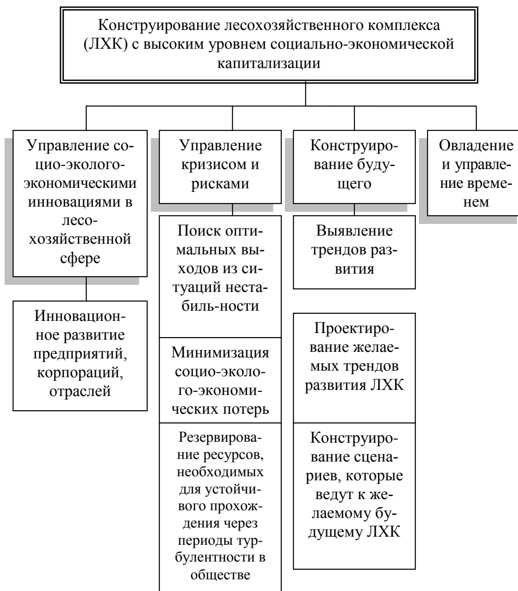
Рис. 2. Аппроксимированная модель конструирования социо-эколого-экономической реальности лесохозяйственного комплекса с ориентацией на лучшее будущее

представляется как проблема овладения и управления сложностью и временем [12, 13].