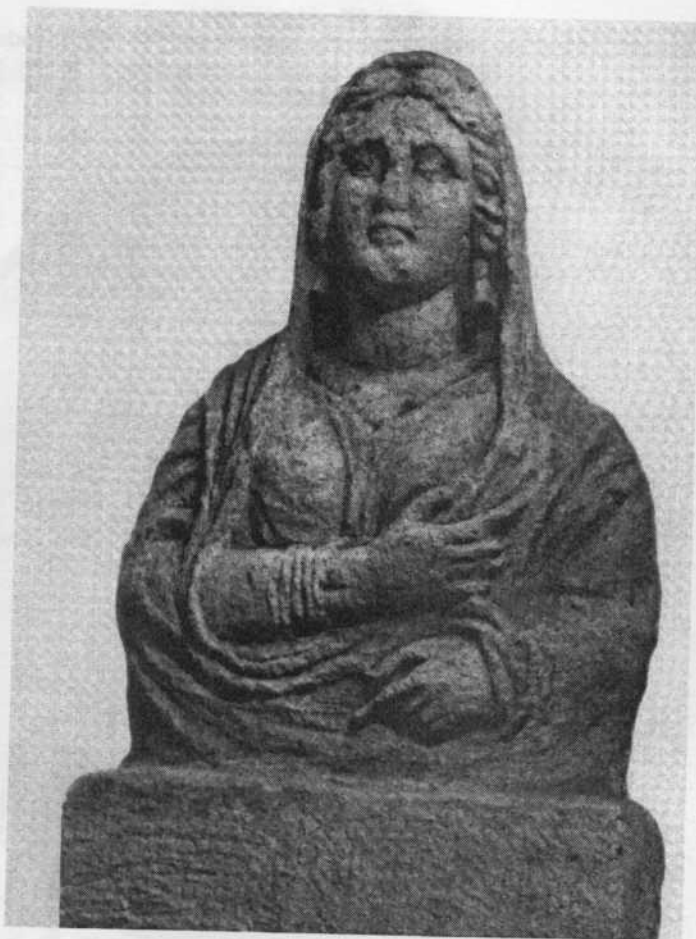
Мал. 4. Портретне зображення на жіночому надгробку з некрополя Пантикапея. Кінець 1 ст. до н. е. – 1 ст. н. е.