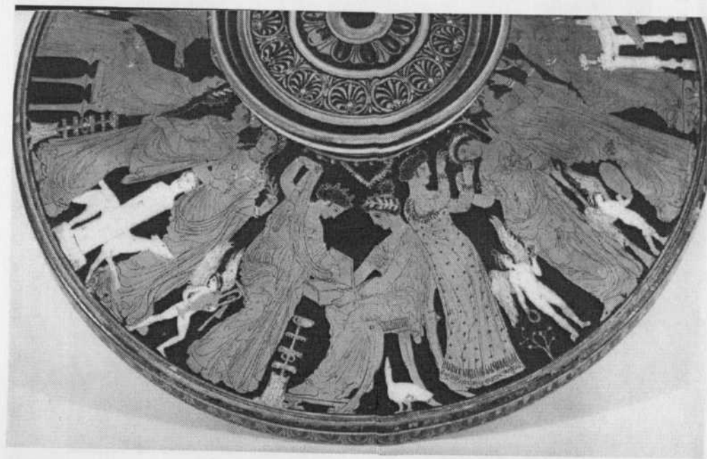
Мал. 6. Сцени туалету жінок у гінекеї. Кришка пекани з Пантікапея. 350-340 рр. до н. е.