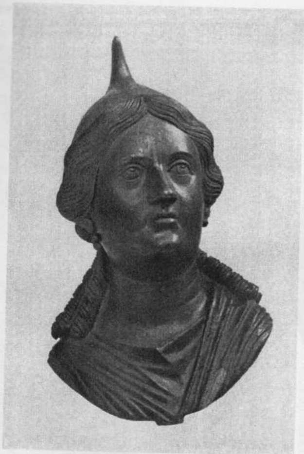
Мал. 3. Бронзовий бюст цариці Динамії, знайдений на Таманському півострові. Кінець 1 ст. до н. е.