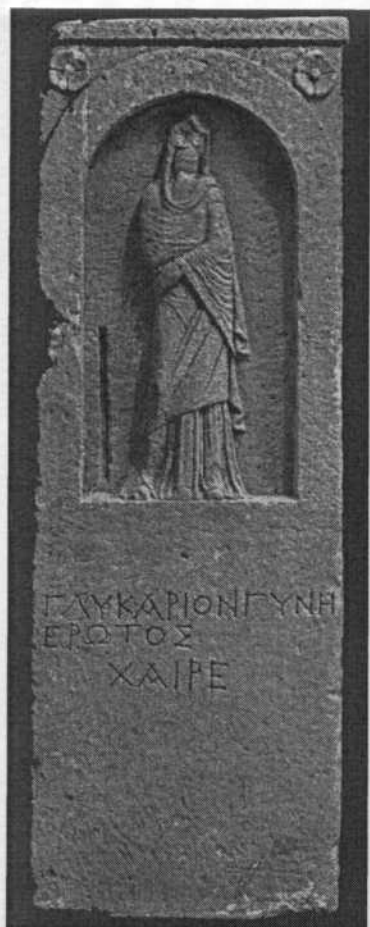
Мал. 5. Надгробок Глікарії з некрополя Пантикапея. Друга половина 1 ст. до н. е.