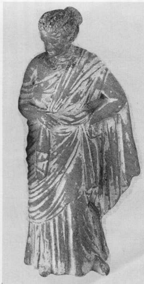
Мал. 7. Танагрська статуетка з Феодосії. IIIIII ст. до н. е.