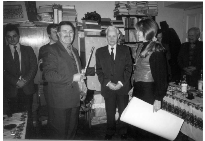
Роман Кирчів серед співробітників Інституту.

Уже будучи визначним вченим-етнографом, Кирчів продовжує працю над питаннями українсько-польських літературних взаємин, наслідком чого стає докторська дисертація “Український фольклор у польській літературі епохи романтизму”, яку захистив у 1980 р.