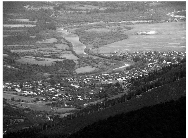
Панорама селища Корчин.

Немає сумніву, що давня бойківська родина Кирчівих, коріння якої, можливо, сягає боярських родин Галицько-Волинської держави, оселившись у дивовижному гірському куточку серед розлогої долини р. Стрий, була носієм традиційного життєвого набутку місцевої людності, з неподатливим характером, особистою гідністю і гордістю за свій край. Франків образ Захара Беркута жив у кожному горянинові.