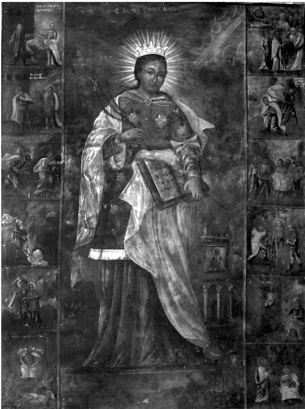
Фото 7. Ікона "Св. влчч Варвара з житієм". 1840 р (?) – напис. Дерев'яна УПЦ МП Святого Архистратига Михайла, 1914 р. с. Перебиківці Заставнівського р-ну Чернівецької обл. 27 червня 2007 р.