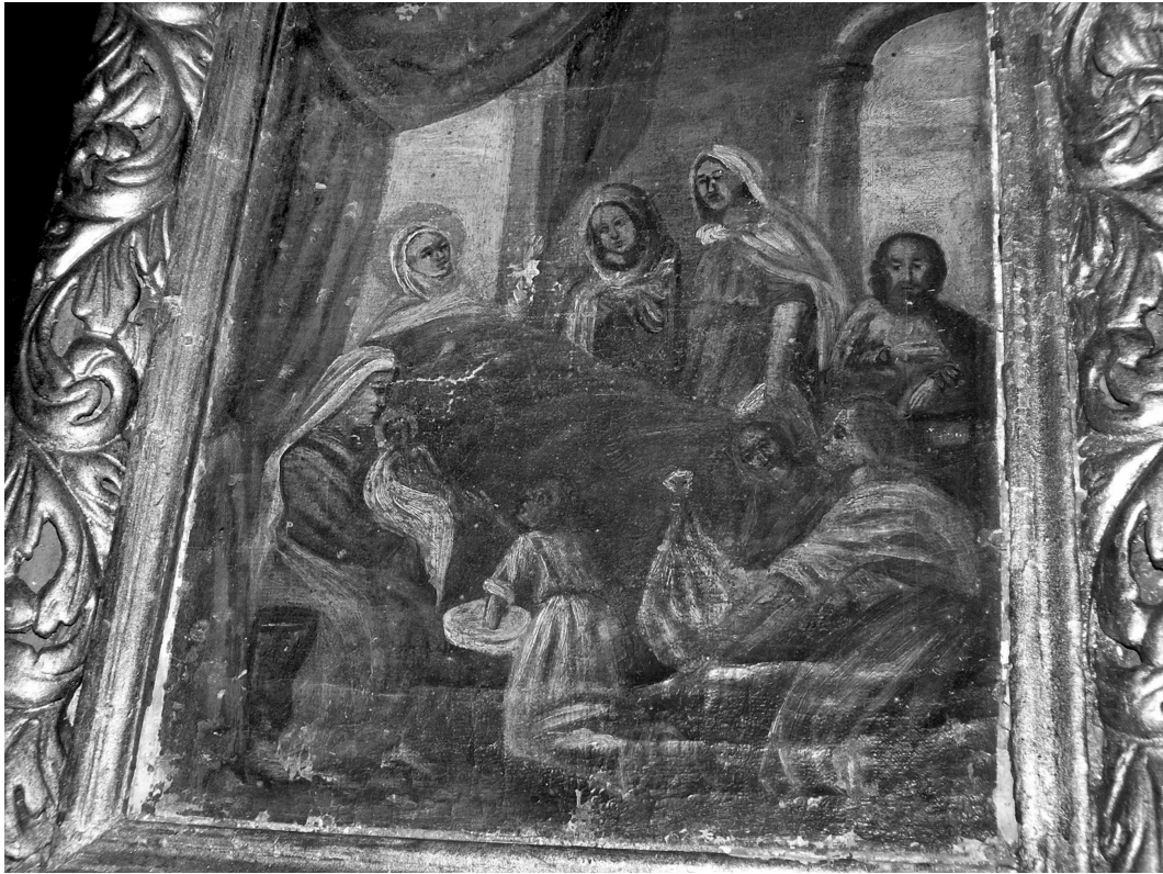
Фото 4. Ікона аналоя (верх, інший ракурс) “Різдво Богородиці” (фрагмент). ХІХ ст. Мурована УПЦ КП Різдва Пресвятої Богородиці, 1894 р. с. Самушин Заставнівського р-ну Чернівецької обл. 26 червня 2007 р.