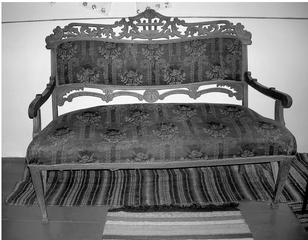
Фото 1. Софа. Кін. XIX – поч. XX ст. Габарити: ширина 119 см, висота 98 см, висота сидіння 41 см, глибина 45 см. Погорілівський музей села при середній школі. Село Погорілівка Заставнівського р-ну Чернівецької обл. 23 червня 2007 р.