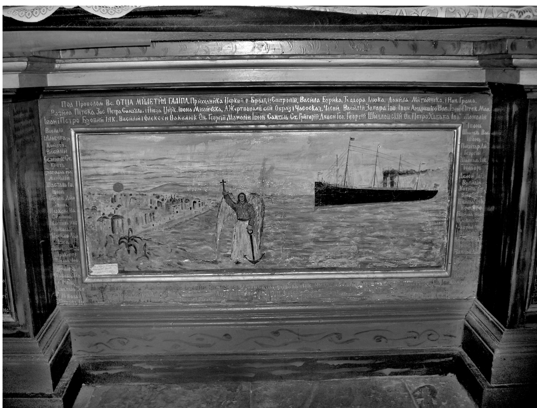
Фото 2. Ікона “Місіонерство” (?) на пределлі бічного вітваря кін. XIX – поч. XX ст. бабинця (пд) з написом. Мурована УПЦ КП св. влмч. Дмитрія, 1887 р. с. Брідок Заставнівського р-ну Чернівецької обл. 25 червня 2007 р.