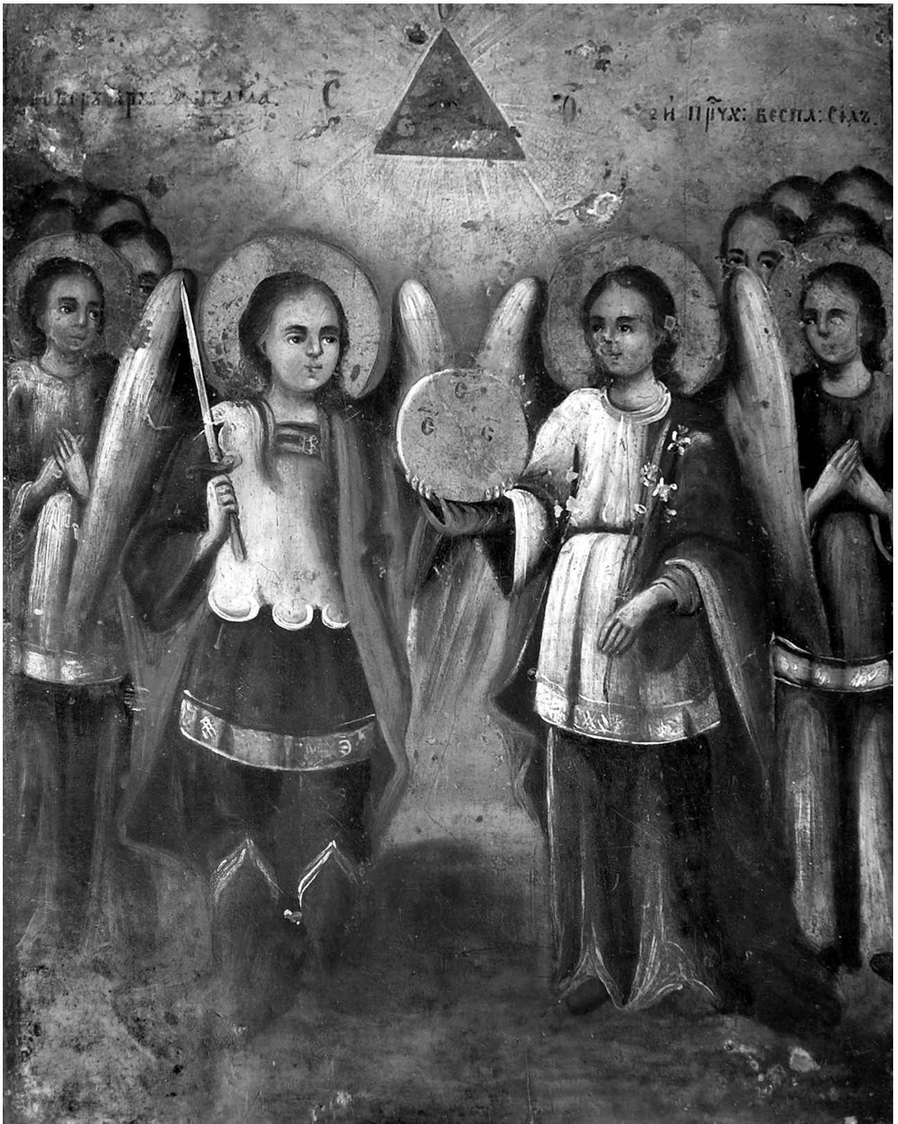
Фото 6. Верх аналая для Євангелія у апсиді з іконою "Собор архангелів пресвятих безплотних сил". XIX ст. Дерев'яна УПЦ МП Святого Архистратига Михаїла, 1914 р. с. Перебиківці Заставнівського р-ну Чернівецької обл. 27 червня 2007 р.