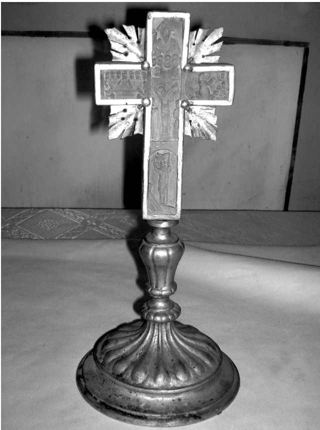
Фото 3. Напрестольний хрест (аверс). Кінець XIX ст. Композиція “Розп’яття”: вгорі – благословляючий Бог-Саваоф над хмарами; лівий кінець – Тайна Вечера з Ісусом Христом та вісьмома апостолами; у центрі – розп’ятий Ісус Христос з пів-фігурами пристоячих, праворуч – моління про Чашу. Внизу композиції в арковидному просвіті – Воскресіння Господнє. Кінець XIX ст. Мурована УПЦ КП Святого Архистратига Михаїла, 1892 р. с. Мосорівка Заставнівського р-ну Чернівецької обл. 26 червня 2007 р.