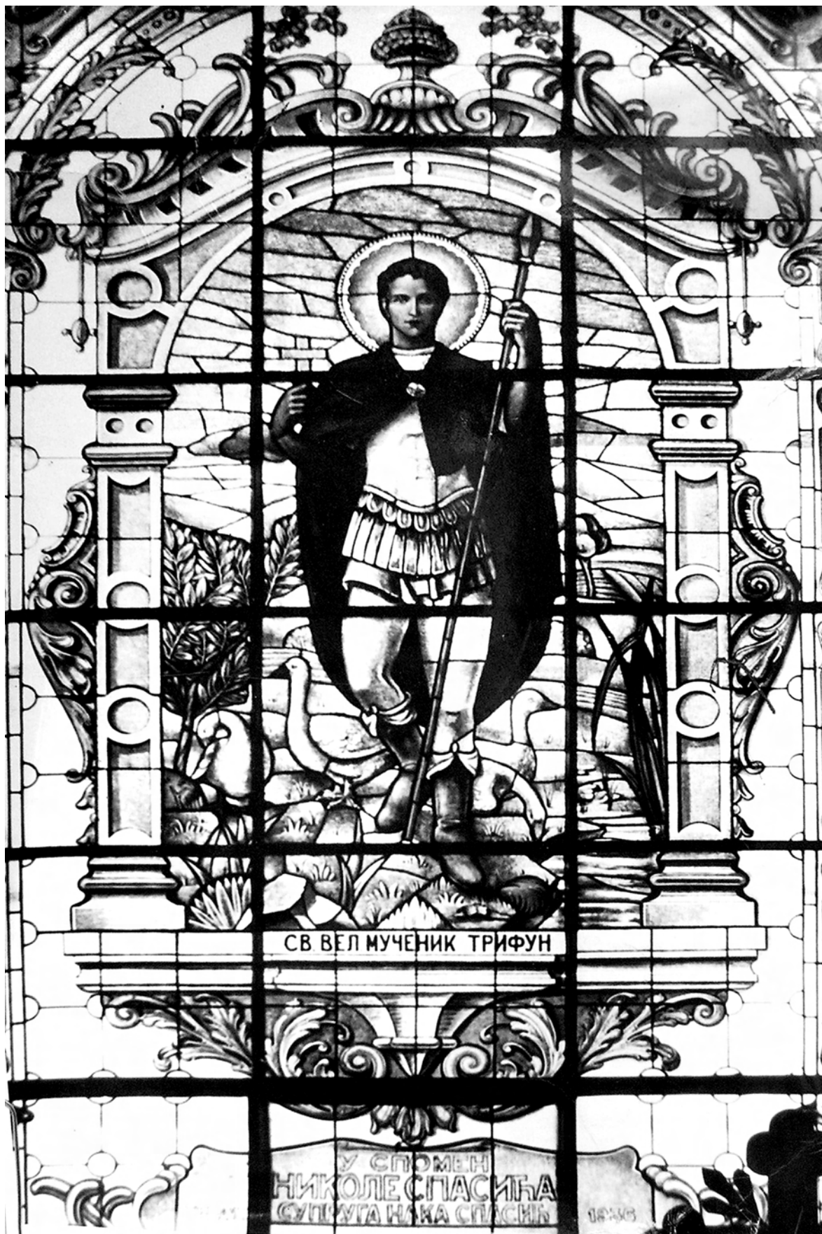
Святой великомученик Трифун. Вітраж Соборної церкви Св. Архистратига Михаїла у Белграді. Петро Карплюк 1936 р.