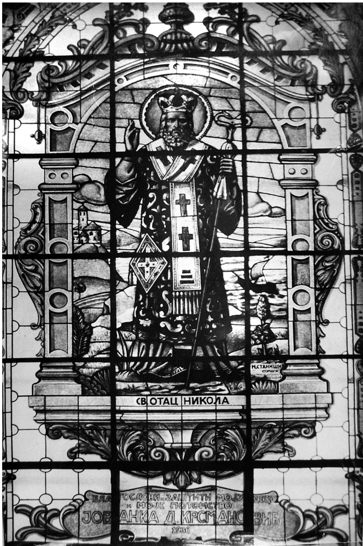
Святий Миколай. Вітраж Соборної церкви Св. Архистратига Михаїла у Белграді. Петро Карплюк 1936 р.