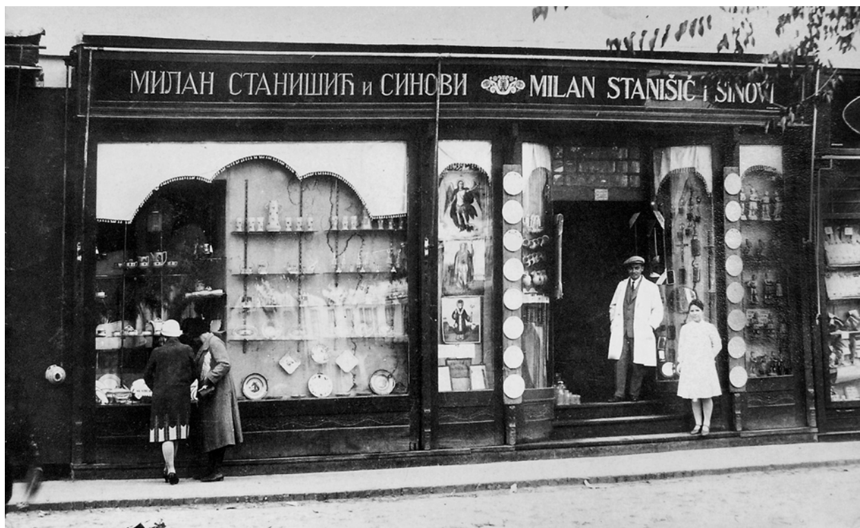
Ательє Станішич і сини. 1930-ті рр.