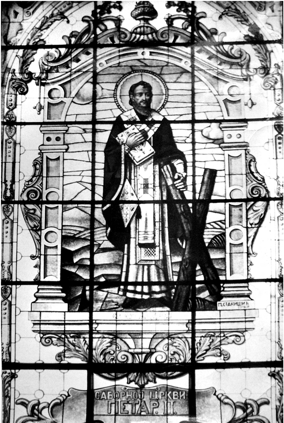
Святий апостол Андрей. Вітраж Соборної церкви Св. Архистратига Михаїла у Белграді. Петро Карплюк 1936 р.