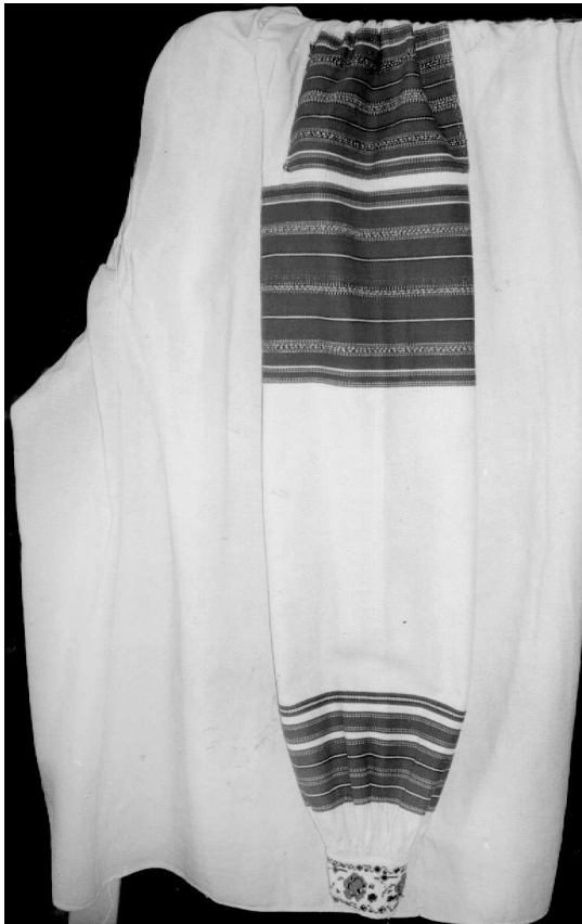
Рукав сорочки, с. Ставок Костопільського р-ну Рівненської обл., Льон, бавовна; конопляне, сатинове тканиня, вишивка. ВКМ Т-2469.