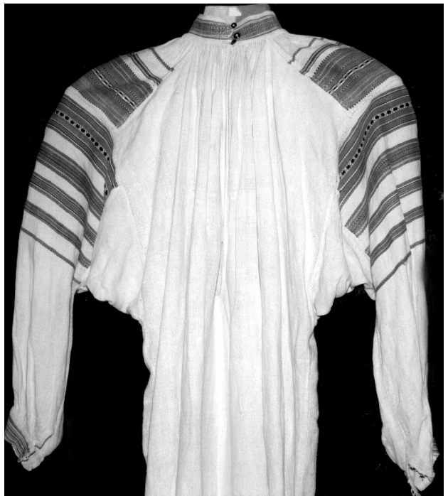
Сорочка, с. Лісове Маневицького р-ну Волинської обл., кін. XIX ст. Льон, бавовна; полотняне, сатинове, перебірне ткання. ВКМ Р2-146.