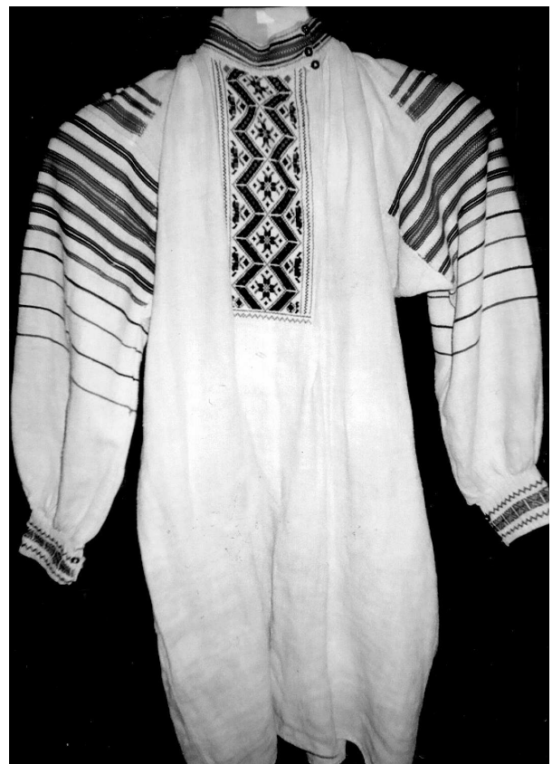
Сорочка, с. Городок Маневецького р-ну Волинської обл., поч. XX ст. Льон, бавовна; полотняне, сатинове тканиня, вишивка. ВКМ Д-200.