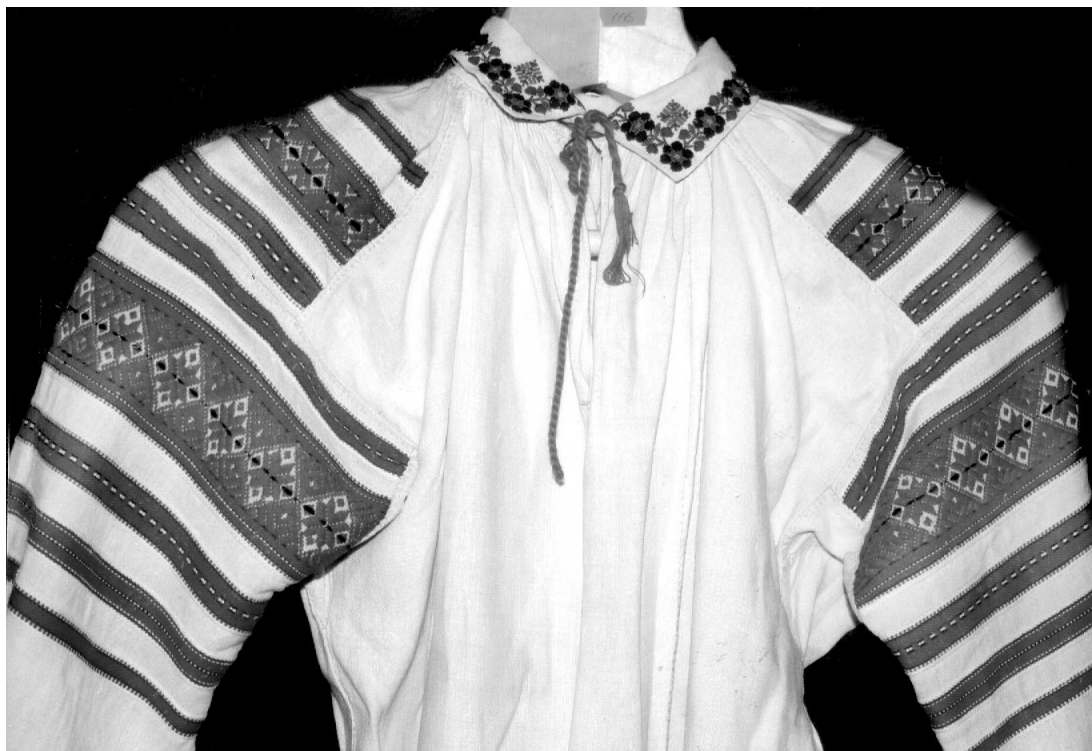
Сорочка, с. Велимче Ратнівського р-ну Волинської обл., кін. XIX – поч. XX ст. Льон, бавовна; полотняне, репсове, перебірне тканиня, вишивка. ВКМ Д-116.