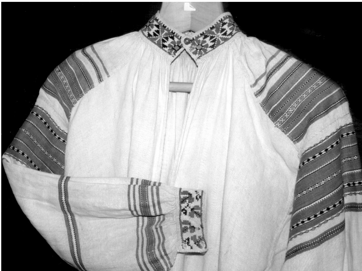
Сорочка с. Градиськ Маневидького р-ну Волинської обл., кін. XIX – поч. XX ст. Льон, бавовна; конопляне, сатинове тканиня, вишивка. ВКМ Р2-300.