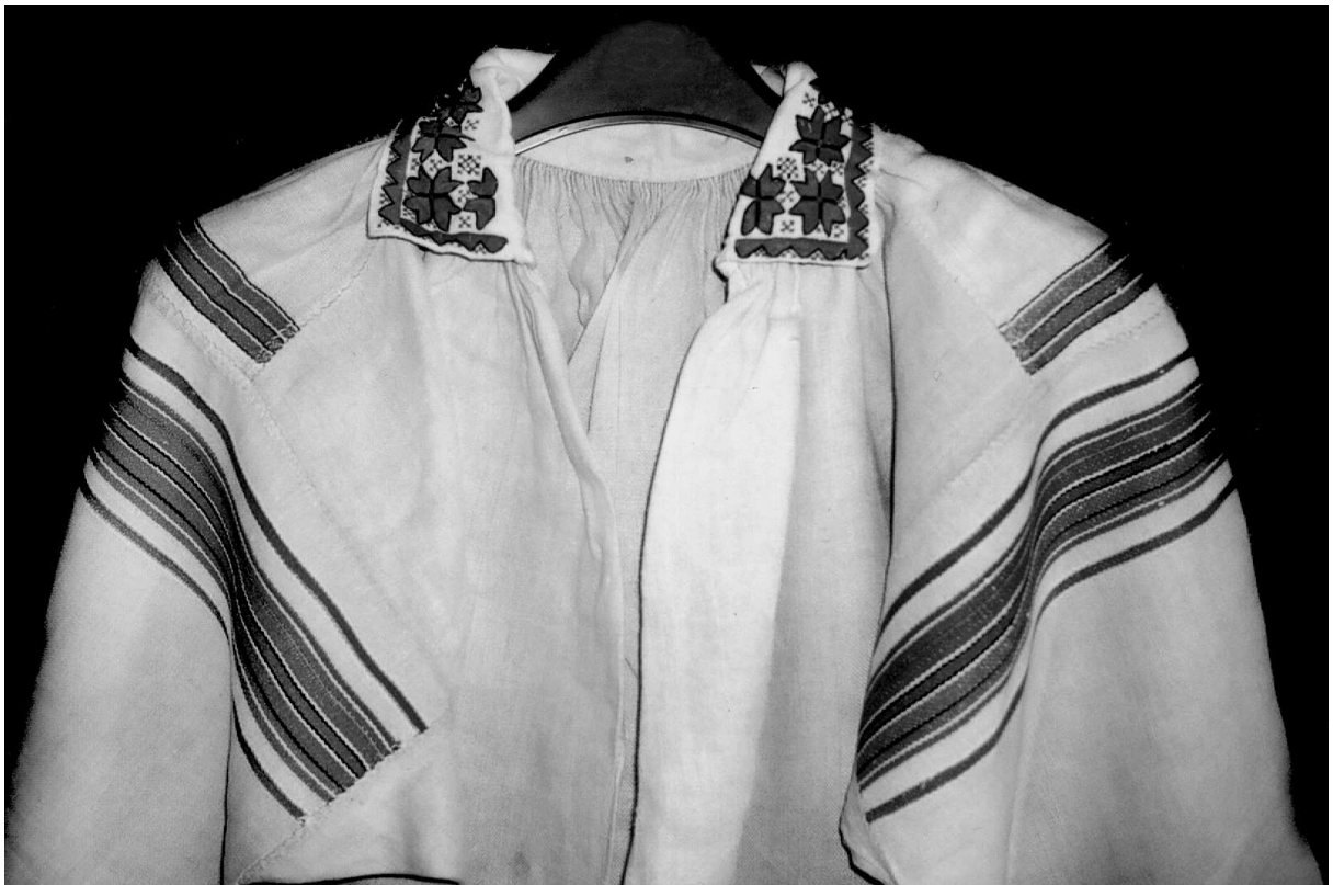
Сорочка. Автор – Оласюк Катерина Максимівна, с. Проходи Любешівського р-ну Волинської обл., I пол. XX ст. Љон, бавовна; полотняне, сатинове ткания, вишивка. МІГ НДФ-476.