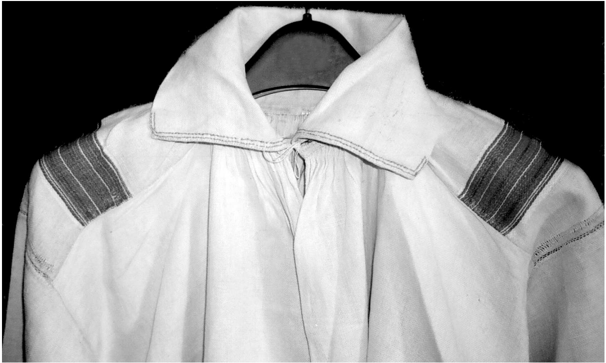
Сорочка. Волинське Полісся, кін. XIX – поч. XX ст. Љон, бавовна; полотняне, сатинове ткания. Музей Івана Гончара (далі МІГ), КН-6543.