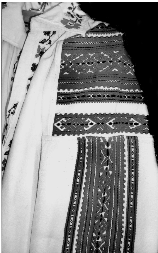
Сорочка. Волинське Полісся., поч. XX ст. Льон, бавовна; полотняне, перебірне ткання, вишивка. МІГ КН-8942.

кої та Гомельської обл.) 85 , а також Росії 86 .