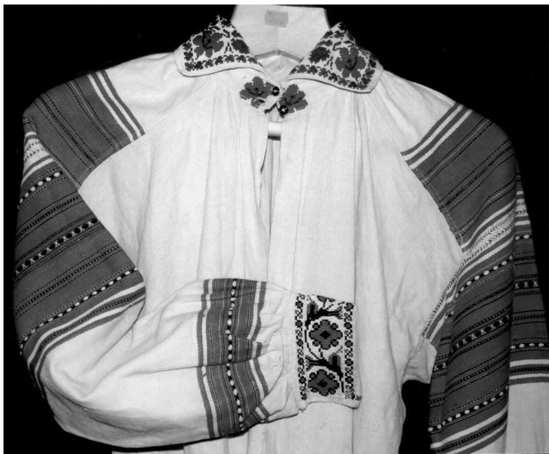
Сорочка. Волинське Полісся, кін. XIX – поч. XX ст. Льон, бавовна; полотняне, сатинове тканиня. ВКМ Д-1506.