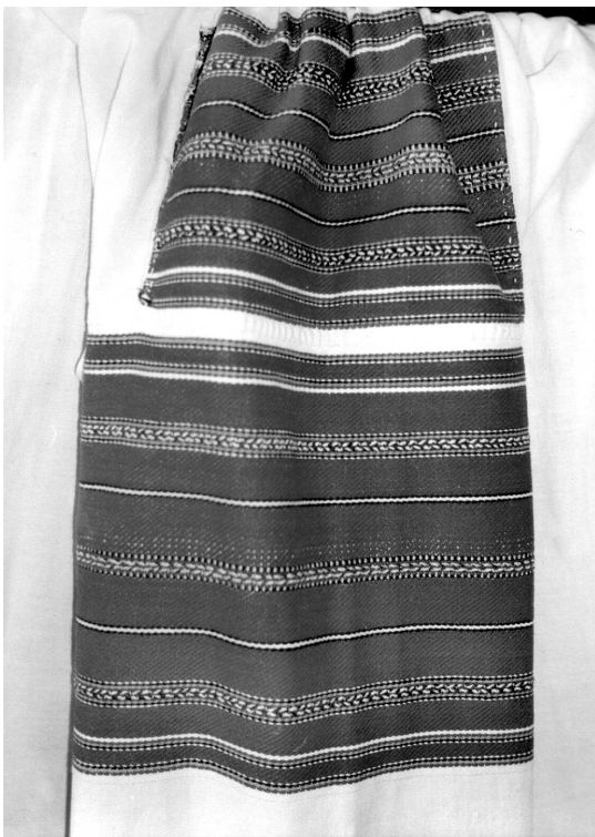
Рукав сорочки (фрагмент), с. Ставок Костопільського р-ну Рівненської обл., Льон, бавовна; конопляне, сатинове тканиня, вишивка. ВКМ Т-2469.

лише на поליках (установках) розташовані узорноткані горизонтальні смуги, а на рукавах – вертикальні 73 .