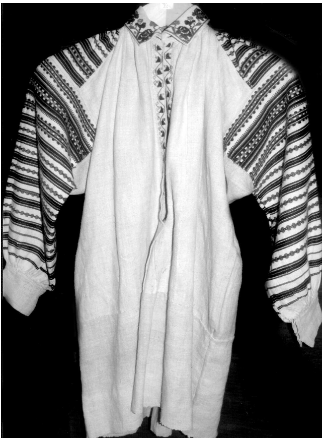
Сорочка, с. Конище Ратнівського р-ну Волинської обл., кін. XIX – поч. XX ст. Їон, бавовна; полотняне, саржеве, перебірне тканиня, вишивка. ВКМ Д-204.

фактурою. Вони рельєфно виступали над гладкотканою лискучою поверхнею червоного тла. Крім того, скручені нитки піткання створювали ефект мерехтливості, що пожвавлювало сприйняття загальної площини декору, урізноманітнювало і збагачувало його. Колоски обабіч підтримувалися ще поодинокими спорідненими прокидками (таких же скручених з двох ниток) контрастних тонів, які візуально сприймалися штрих-пунктирними лініями.