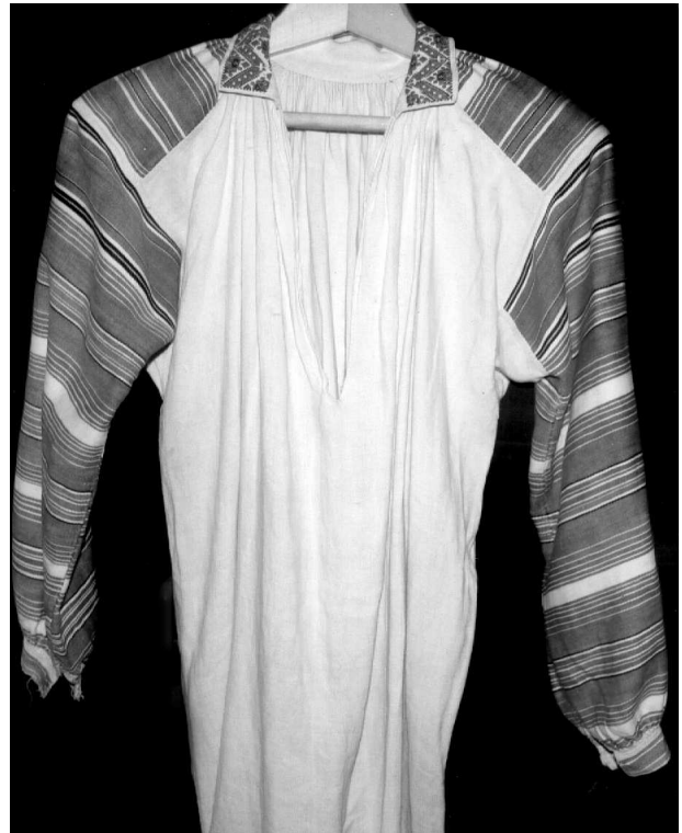
Сорочка, с. Щедрогір Ратнівського р-ну Волинської обл., кін. XIX – поч. XX ст. Льон, бавовна; полотняне, сатинове тканиня, вишивка. ВКМ Д-181.

Рапортна система укладу смуг, однак значно складніших – три- і п'ятидільних, характерна і для декоративного вирішення інших сорочок (із Сарненського р-ну Рівненської обл.) 48 та с. Річи-