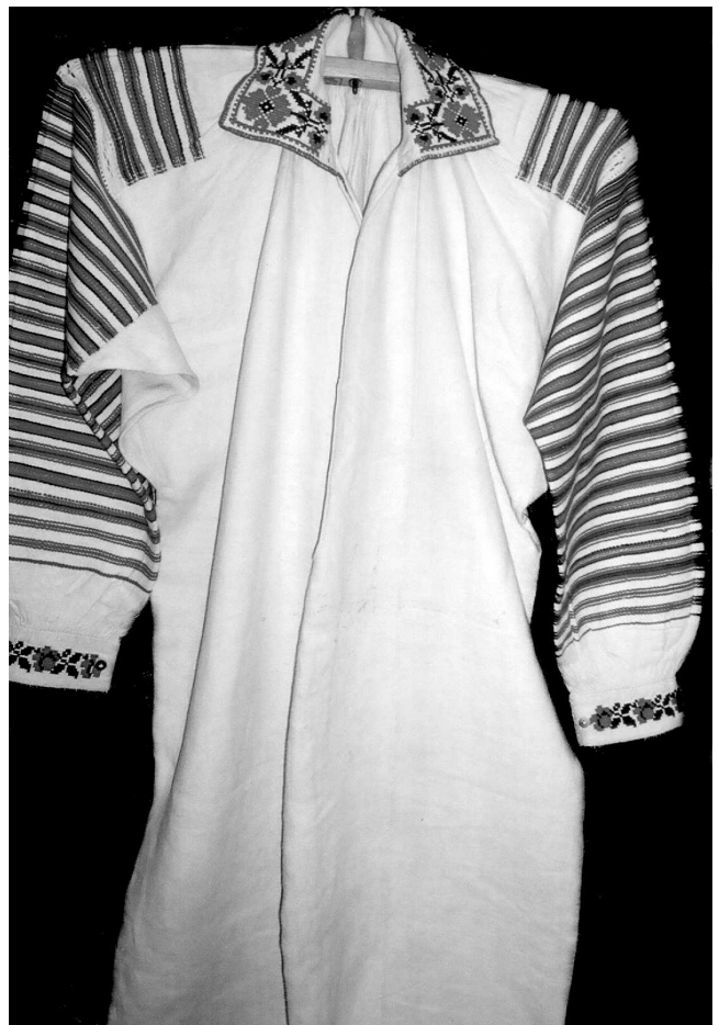
Сорочка Сарненський р-н Рівненської обл., кін. XIX – поч. XX ст. Льон, бавовна; полотняне, саржеве тканиня, вишивка. МІГ КН-8654.