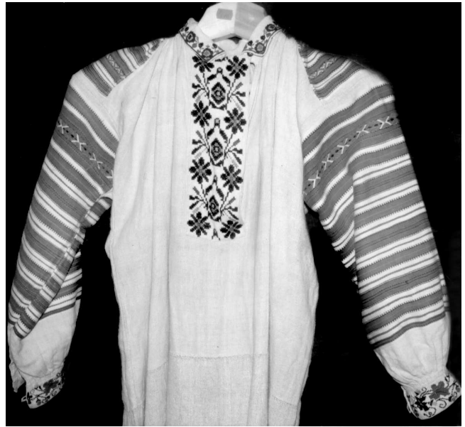
Сорочка, с. Щедрогір Ратнівського р-ну Волинської обл., кін. XIX – поч. XX ст. Льон, бавовна; полотняне, сатинове тканиня. ВКМ Д- 182.

Інший тип означеної підгрупи складають тканини для сорочок, в яких для полика і верхньої частини рукава ткали доволі широкі, масивні, взористі площини. Іноді одна така група займала