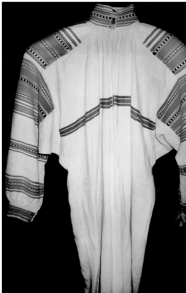
Сорочка, с. Тельчі Маневицького р-ну Волинської обл., кін. XIX – поч. XX ст. Љон, бавовна; полотняне, сатинове тканиня, вишивка. ВКМ Д-1152.

сорочок, в яких провідними були чорні смуги, а темно-червоні чи вишневі підпорядковувалися їм. Такі сорочки очевидно вдягали в часи посту чи трауру, або призначені були на смерть. При виготовленні готового виробу – сорочок для зрівноваження й доповнення гладкотканих однотонних площин на уставках, пазусі та манжетах теж оздоблювали чорним і червоним орнаментом із геометризвано-рослинних, а комір-стійку – геометричних мотивів (с. Кисилин Локачинського р-ну Волинської обл.) 11 .