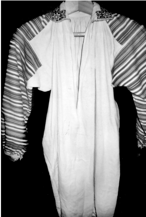
Сорочка, с. Річиця Ратнівського р-ну Волинської обл., кін. XIX – поч. XX ст. Їон, бавовна; полотняне, сатинове тканиня. ВКМ Д- 924.