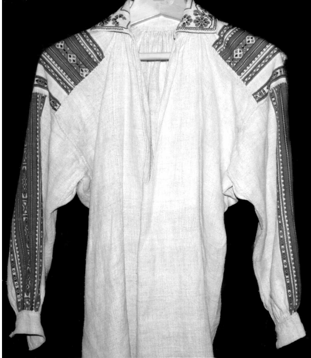
Сорочка, с. Мельники Любомльського р-ну Волинської обл., кін. XIX – поч. XX ст. Льон, бавовна; полотняне, перебірне ткання. ВКМ Д-2321.