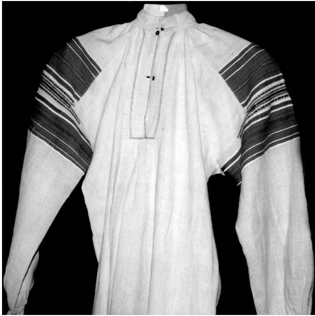
Сорочка. с. Четвертня Маневицького р-ну Волинської обл., кін. XIX ст. Љон, бавовна; полотняне, сатинове тканиня, вишивка. Волинський краєзнавчий музей (далі ВКМ) Р2-401.