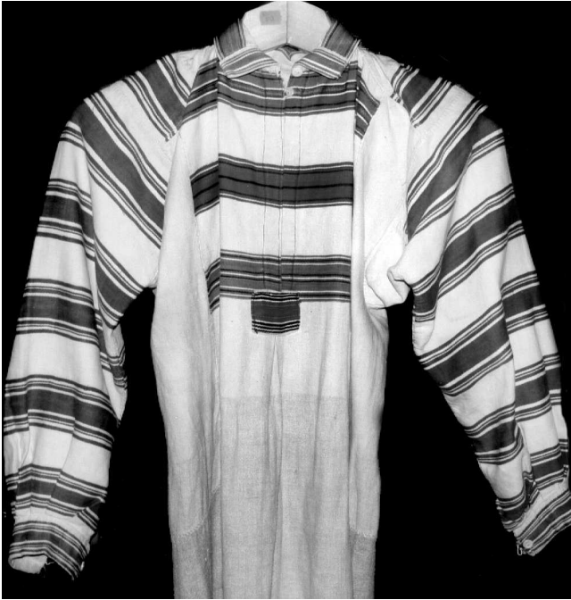
Сорочка, с. Самари Ратнівського р-ну Волинської обл., кін. XIX – поч. XX ст. Їон, бавовна; полотняне, саржеве, сатинове тканиня. ВКМ Д-82.