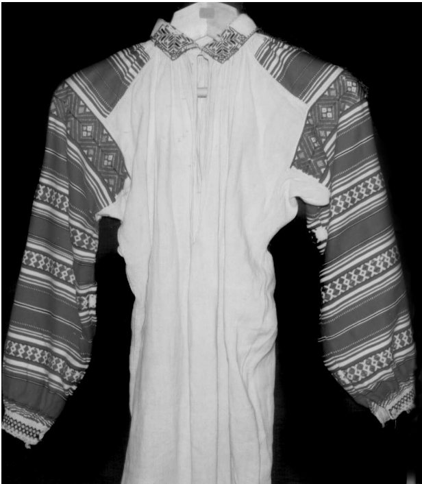
Сорочка, с. Заброди Ратнівського р-ну Волинської обл., кін. XIX – поч. XX ст. Їон, бавовна; полотняне, сатинове тканиня. ВКМ Д- 210.

вузенькі, теж парні, жовті, вохристі і чорні пасочки, які акцентують внутрішню розробку головних безузорних площин, призначених для оздоблення верхньої частини рукава. Нижче – на значній, щораз більшій відстані, укладено тоненьку і подвійні та поодинокі стрічки, які формують спадаючий ритм смуг. Для поликів виготовляли набагато вужчу основну червону стрічку, а вище неї – декілька (3-4) щораз вужчих гладкотканних пасочків на все більшій відстані. Вони створюють плавний перехід до нейтрального білого тла уставок (с. Ветли Любешівського р-ну) 29 .