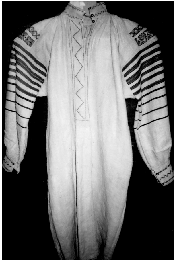
Сорочка, с. Городок Маневицького р-ну Волинської обл., кін. XIX ст. Льон, бавовна; полотняне, сатинове, перебірне ткання, вишивка. ВКМ Д-814.

Чи не найвишуканішими за композицією є однотипні варіанти сорочок, у яких усі частини декору узорнотканих сорочок (розташовані й на інших ділянках рукавів, на манжетах і комірі) в арсеналі засобів досягнення мистецької виразності мали домінуючі павучкові стрічки. У головних площинах, призначених для розташування на поліках, та у верхній частині рукавів таких “павучкових” стрічок було по три. Вони різнилися лише тим, що на поліках бічні, симетрично укла-