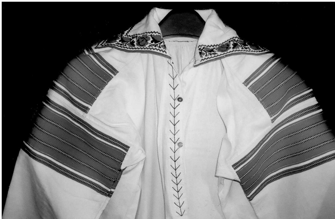
Сорочка. Волинське Полісся. I пол. XX ст. Льон, бавовна; полотняне, сатинове тканиня, вишивка. МІГ КН-6532.