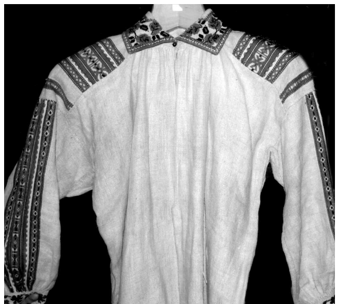
Сорочка, с. Горигляди Любомльського р-ну Волинської обл., кін. XIX – поч. XX ст. Льон, бавовна; полотняне, перебірне ткання. ВКМ Р-305.