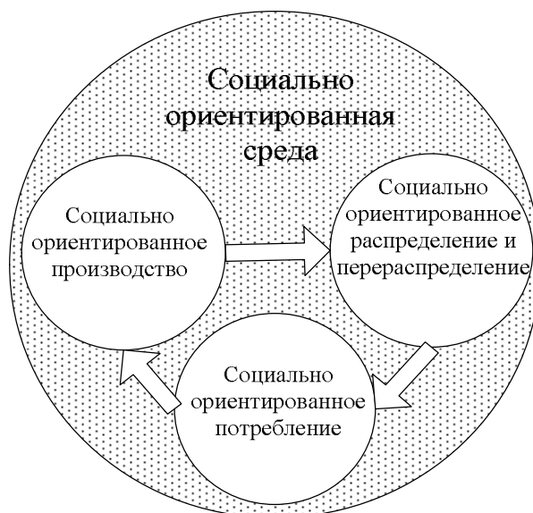
Рис. 1. Взаимосвязь сфер социально ориентированной экономики

Социально ориентированное производство должно быть по своей сути инновационным. Это обусловлено глобальными тенденциями модернизации общества, основанной на модели научно-технического прогресса и разделения труда в мировом масштабе. Наблюдается устойчивая тенденция уменьшения доли занятых в производстве благ, направленных на удовлетворение базовых потребностей. Так, количество занятых в сельском хозяйстве, охоте и лесном хозяйстве Украины сократилось с 4,33 млн чел. в 2000 г. до 3,09 млн чел. в 2010 г., что по отношению к общему количеству занятых соответствует снижению с 21,5 до 15,3%. За промежуток времени в 50 лет тенденция относительно количества наёмных работников имеет еще более выраженный характер. С 1960 по 2010 г. количество наемных работников в сельском хозяйстве, охоте и лесном хозяйстве снизилось с 6,6 до 0,8 млн чел., или с 32,7 до 3,9 % от общего количества занятых [1, с. 344].