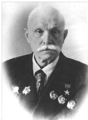
Євген Оскарівич ПАТОН