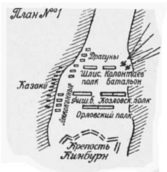
План № 1

Мотивом зведення Кінбурнської фортеці Туреччиною у XVст. 2 було бажання за її допомогою закрити доступ запорозьких чайок в Чорне море, тим самим унеможливити піратські напади на кораблі Порти. Місце на самій західній кінцівці Кінбурнської коси, яке російські джерела видають за Кінбурн, унеможливило виконання тих завдань, які ставились згідно ідеї побудови фортеці. Вигадане за залишки фортеці місце представляє собою ділянку піщаної коси