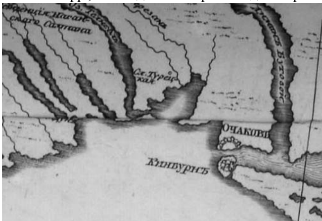
Витяг з «Пограничная карта Российской и Турецкой империи и Польши» Я.Ф.Шмідта від 1759 р.

Як бачимо, мапа чітко вказує, що місто-фортеця знаходиться біля Кінбурнської коси на острівку, відомому в наш час, як острів Майський. Іншим представленим документом про місцезнаходження Кінбурну являється мапа Єлисаветградської провінції 1772-1774 рр., яка є однією з перших відомих російських мап відносно регіону Північного Причорномор'я 8 .