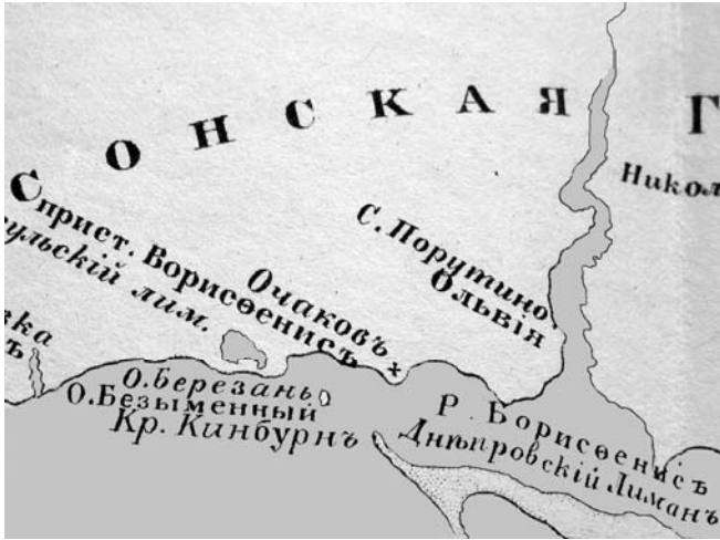
Витяг з мапи 11

І дійсно, острів-фортеця контролював рух суден в акваторії Дніпро-Бузького лиману. Через близькість до острова коси і можливість з неї нападу ворога, вже згаданий полковник Пищевич повідомляє, що від загрози з коси на Кінбурну встановлено десять гармат. 12