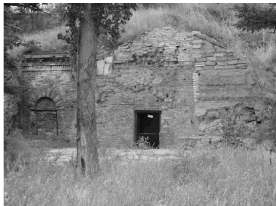
Фото Кінбурну і його споруд, схованого під назву Майський та під землею 21

Зі сторінок Інтернету дізнаємось про ще одну фальшивку, що буцімто за наказом Г.О.Потьомкіна у 1790 р. почалась розбудова острову Майський 22 , локалізованого на цих сторінках як Кінбурн. Не було у Потьомкіна під час бойових дій виснажливої війни знайти фінансові ресурси, матеріальні та значну кількість людської сили для спорудження затратної будови.