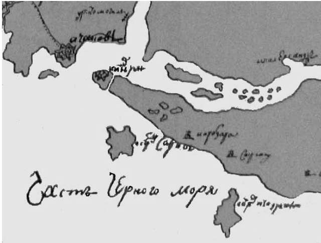
Витяг з мапи Єлизаветградської провінції 1772-1774 рр.

це висадки десанту противника. Досвідчений полководець не організував би