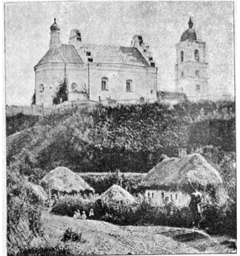
Іллінська церква в Суботові. Світлина кінця 90-х рр. XIX ст.

А коло батькової могили стояв кволий, безталанний Юрась, що потім бив гарматами з Чигиринської гори на батькову оселю. Бачили в собі ці мури й Івана Виговського,