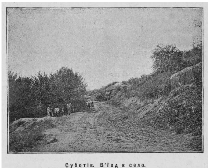
Суботів. В'їзд в село.

«...на другий день раненько, забравши свої клунки, почимчикували пішки до славного гнізда гетьманського – до села Суботова. До нього від Чигирина сім верст. Дорога йде весь час низом понад Тясмином, а ліворуч над самим шляхом тягнеться високий правий беріг. Богдан Хмельницький їздив, кажуть, до Чигирина верхньою дорогою, а вертався низом. Суботів розкинувся мальовничо на горі, перерізаний глибокими ярами, а в низу Тясмин серед очеретів, осокорів, явору.