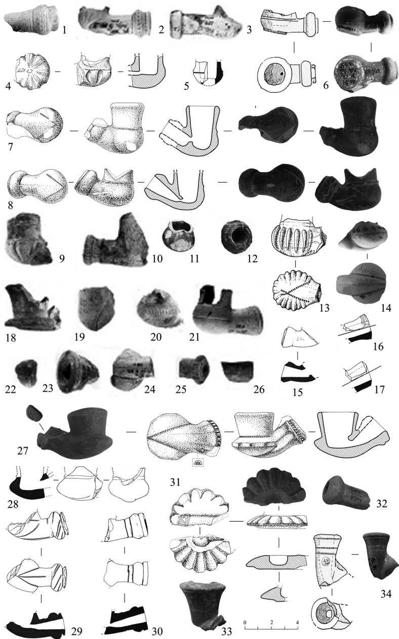
Рис. 2. Алустон. Обломки и целые формы трубок.