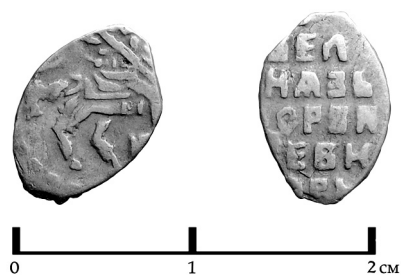
Рис. 4. Копейка, 1676-80 гг. (КГ1426)