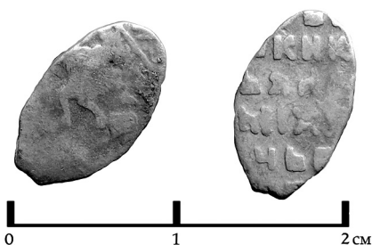
Рис. 3. Копейка, 1650-55 гг. (КГ0942)