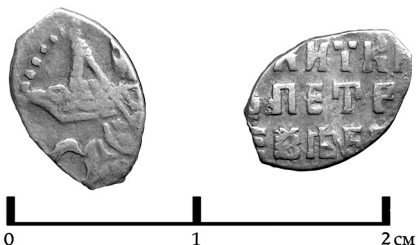
Рис. 5. Копейка, 1682-96 гг. (КГ1567)