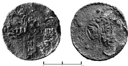
Рис. 2. 5 копеек Екатерины I, 1727 г. (Биткин 280)