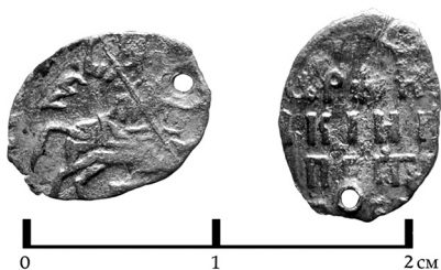
Рис. 6. Копейка, 1699 г. (КГ1625)

1727 г. и не позднее начала 1730-х годов. Косвенно об этом говорит отсутствие медных монет Анны Иоанновны, отчеканенных по 10-рублевой стопе, которые в отличие от пятикопеечников 1724–1730 гг., отчеканенных по 40 рублевой, были практически полноценной монетой. Так же данный комплекс подтверждает письменные источники о совместном бытовании в денежном обращении на землях Левобережной Украины 1720–1730-х гг. монет как Речи Посполитой, так и России, причем из последних население отдавало предпочтение серебряным проволочным копейкам [7].