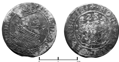
Рис. 1. Ort gedanensis, 1623 г.