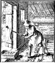
Рис. 1. Добування селітри «стінним способом». Середньовічна гравюра.