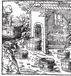
Рис. 2. Вигляд європейської селітроварної «майстерні». Гравюра з праці Г. Агріколи «De re metalica» (1556 р.).