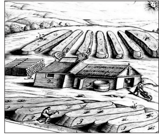
Рис. 3. Селітроварний завод з буртовим способом виробництва на німецькій гравюрі середини XVI ст. Малюнок з книги О. Гуттмана «Monumenta pulveris pyrii» (1906 р.).

і на варниці XVII ст. – поч. XVIII ст. Але як було наведено вище, все ж таки принципова різниця між ними існує. Саме аналіз цих аспектів дає змогу здійснити спробу періодизації селітродобувної справи на Лівобережжі.