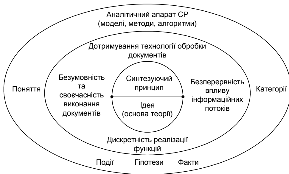
Рис. 1. Структура теорії ситуаційного регулювання технологічних процесів у органі влади

На основі проведених досліджень, аналізу науково-технічних джерел в якості такої теорії запропоновано теорію ситуаційного регулювання (СР) технологічних процесів у органі влади при автоматизованій обробці окремих інформаційних потоків (рис. 1).