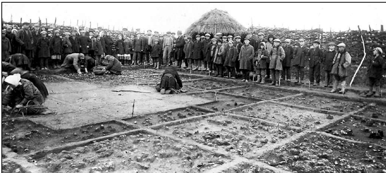
Рис. 2. Розкопки палеолітичної стоянки у с. Пушкарі 1933 року (НА ІА НАНУ, ф. 30 (М. Я. Рудинський), стр. 33)