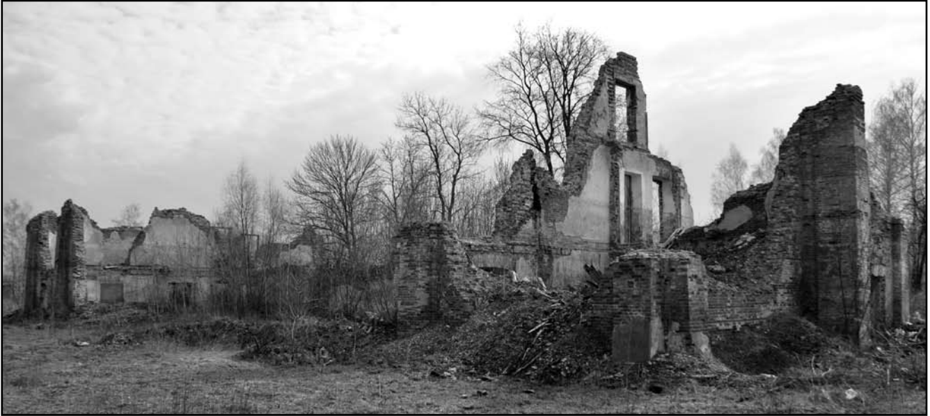
Рис. 4. Руїни триповерхової казарми. 2011 р.

термінологією початку ХХ ст., документ важко сприймається людиною, яка не має відношення до будівельної справи. Подаємо мовою оригіналу лише відомості про етапи будівельних робіт: