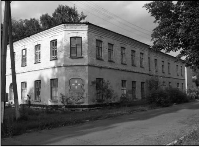
Рис. 5. Будівля двоповерхової штабної казарми 175 Батури́нського полку. 2010 р.

38. Устроїть люфт-клозети с вытяжными чугунными трубами, бетонными ступ чанами, бетонными сборниками и двумя кирпичными вигребами, всего очек 16».