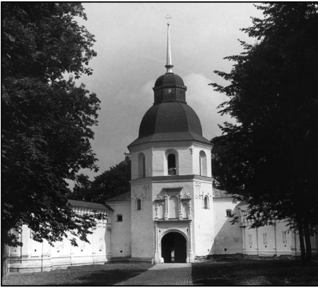
Рис.4. Вежа-дзвіниця Спасо-Преображенського монастиря. Фото кінця ХХ ст.

чинив архімандрит, за винятком випадків вбивства чи розбою. Усі товари, що продавались чи купувались монастирем, не обкладалися митом. Усе це мало сприяти швидкому економічному розвитку обителі.