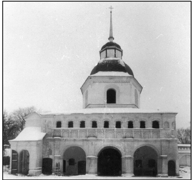
Рис. 3. «Свята брама» з боку монастирського двору виглядає зовсім не войовничо. Фото кінця XX ст.

Із земель, які належали до Новгород-Сіверського повіту, перелічені такі: слобідка біля монастиря і землі навколо, дворове місце на посаді, у самій міській фортеці, шість поселень та чотири починки, крім цього німецькій млин на річці Ромі, рибні ловлі – понад двадцять озер, інші володіння. У Путивльському повіті