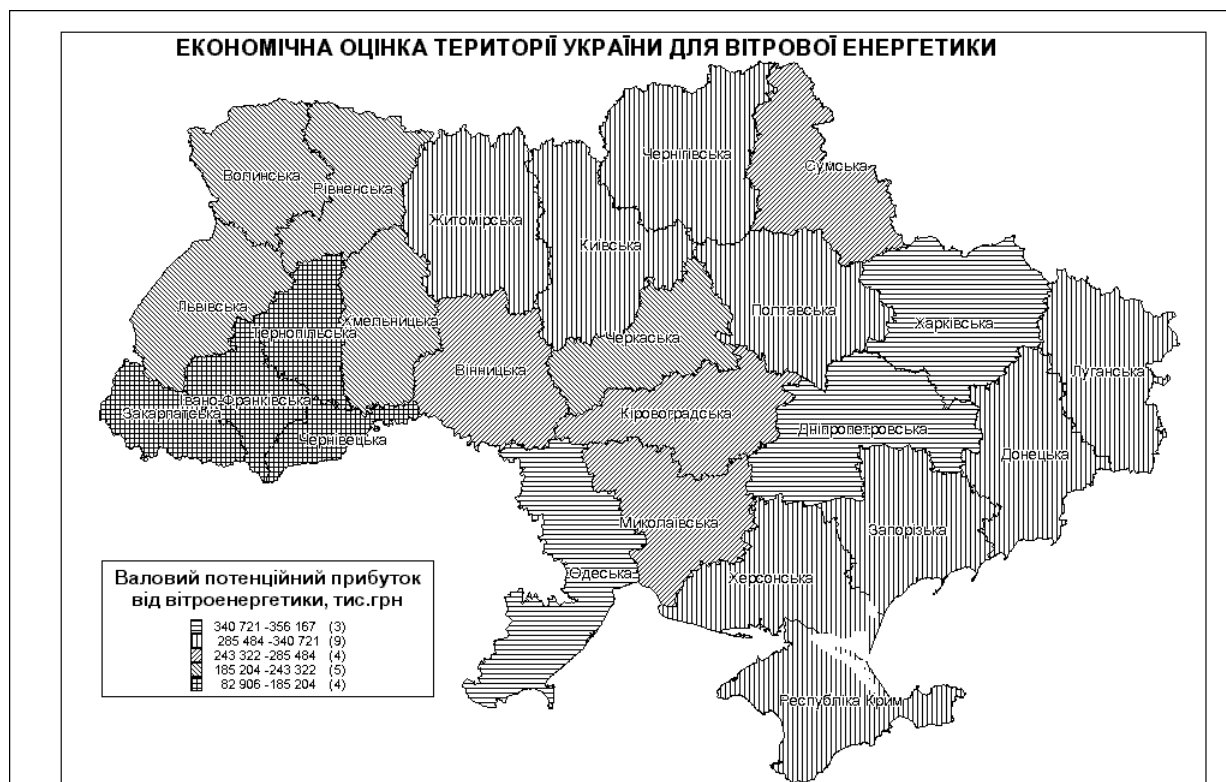
Рис.2 Економічна оцінка території України для вітрової енергетики