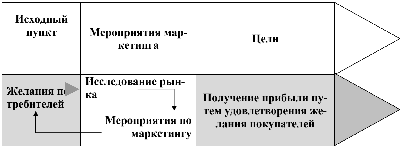
Рис. 2. Современная концепция маркетинга.