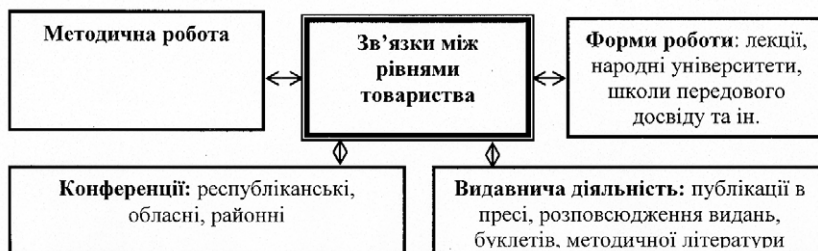
Рис. 2. Міжрівневі зв'язки товариства

пулярності серед населення, але сприяли налагодженню зв'язків між ними. Взаємодія відбувалася через проведення міжрівневих науково-практичних конференцій, урізноманітнення форм роботи (читання публічних лекцій; організацію народних університетів із різних галузей знань, видання та поширення науково-популярної літератури, плакатів, буклетів із різних проблем науки та техніки; заснування шкіл передового досвіду; проведення днів науки тощо), організацію методичної роботи, здійснення видавничої діяльності та інше (Рис.1.2).