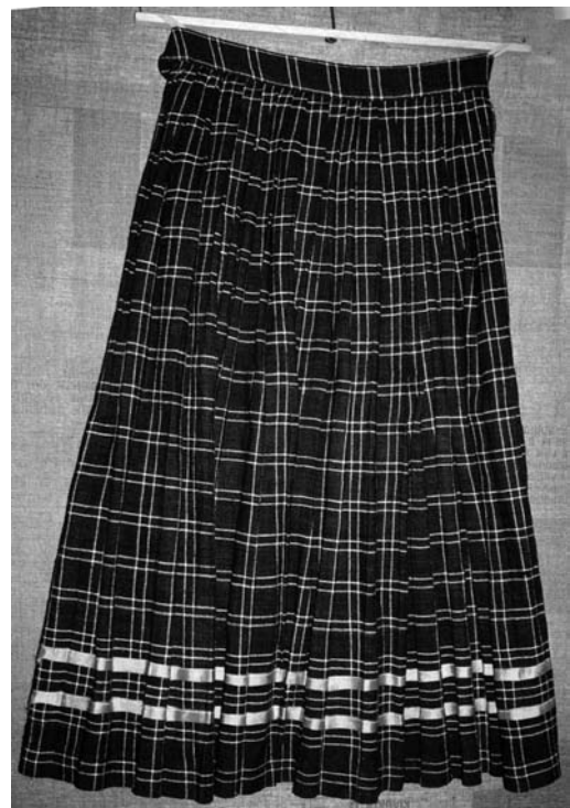
Спідниця, поч. XX ст. с. Краватка Рожищенського р-ну Волинської обл. Льон, полотняне ткання. ВКМ. Р2-148.