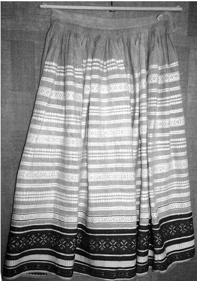
Спідниця “фартух”, 1920-30-ті рр. с. Теклине Камінь-Каширського р-ну Волинської обл. Льон, бавовна; полотняне й перебірне тканиня “під дошку”. ВКМ. Р2-212.

площин (Камінь Каширськ) 17 . Нижня, переважно вузька червона стрічка розташовувалася на відстані двох-трьох сантиметрів від краю виробу. Зовнішні краї цих двох (чи трьох) барвистих взористих площин завершені зубчастим силуетом, створеним перетиком 1/1 чи перебором – по дві нитки, позбавляли їх сухості сприйняття, вносили певний ліризм. Загалом ця орнаментальна стрічка акцентувала долішню частину виробу.