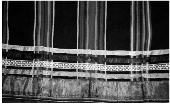
Спідниця (фрагмент), поч. ХХ ст. Автор Гоць Катерина Андріївна. с. Купичів Турійського р-ну Волинської обл. Льон, саржеве ткання. ВКМ. Д-300.

Характерною особливістю вовняних тканин полотняного переплетення, з яких шили “літники”, є рапортні композиції (величина рапортів коливається від 6-7 до 20-25 см). Типовою для них є симетричність укладу домінуючих і підпо-