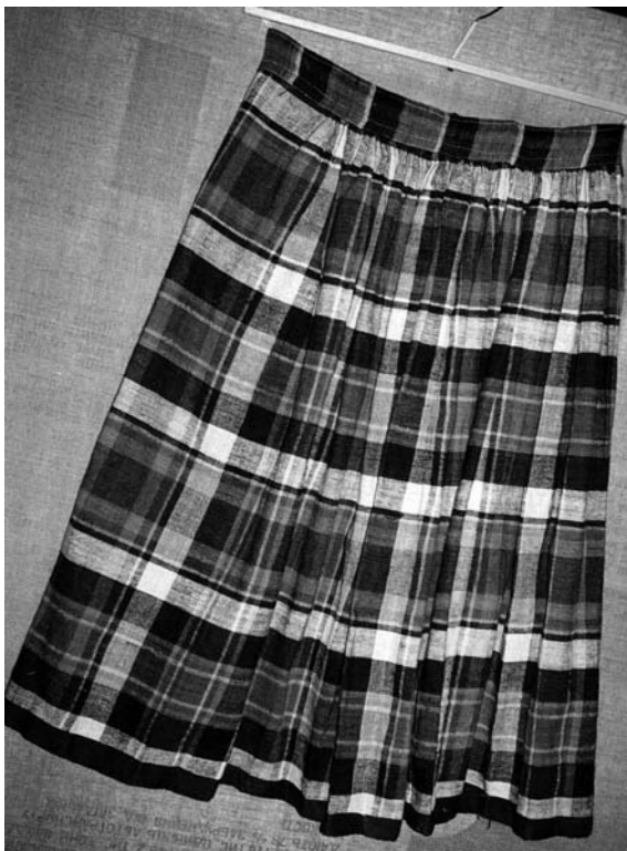
Спідниця, 1950 рр. с. Полиці Старовижівського р-ну Волинської обл. Льон, полотняне тканиня. ВКМ. Д-1115.

лексів, строга ритмічність укладу таких смуг, неоднакових за насиченістю тону. Найчастіше цю ритмічність підкреслюють світліші контрастні – як до інших суміжних стрічок, так і до тла – широкі білі та жовті смуги. Тоненькі уточні прокидки у вигляді штрих-пунктирних ліній підтримують їх, збагачують та урізноманітнюють ритміку по вертикалі. Найбільш напружені кольорові сполуки, побудовані на контрасті теплих і холодних барв, зосереджені передусім біля поділка.