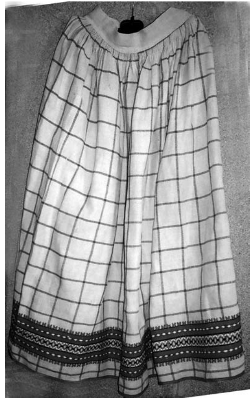
Спідниця “літник”, кін. XIX – поч. XX ст. с. Воронкомле Камінь-Каширського р-ну Волинської обл. Полотняне, репсове й перебірне ткання. МІГ. КН-1021.

Інший тип композиції щільних тканин для спідниць складають білі поперечносмугасті з домінуючою червоною площиною геометричного орнаменту, розташованого на поділці спідниці. На відміну від попередніх біле тло і тонкі сірі трип’ятидільні смужки (рапорт 4-5 см) ткали саржевим переплетенням, внаслідок чого отримували товстіше дрібновзористе полотнище у вигляді горизонтально спрямованих вправо і вліво “сосенок”, які позмінно чергуються. Виразності форм геометричних мотивів та активності звучання