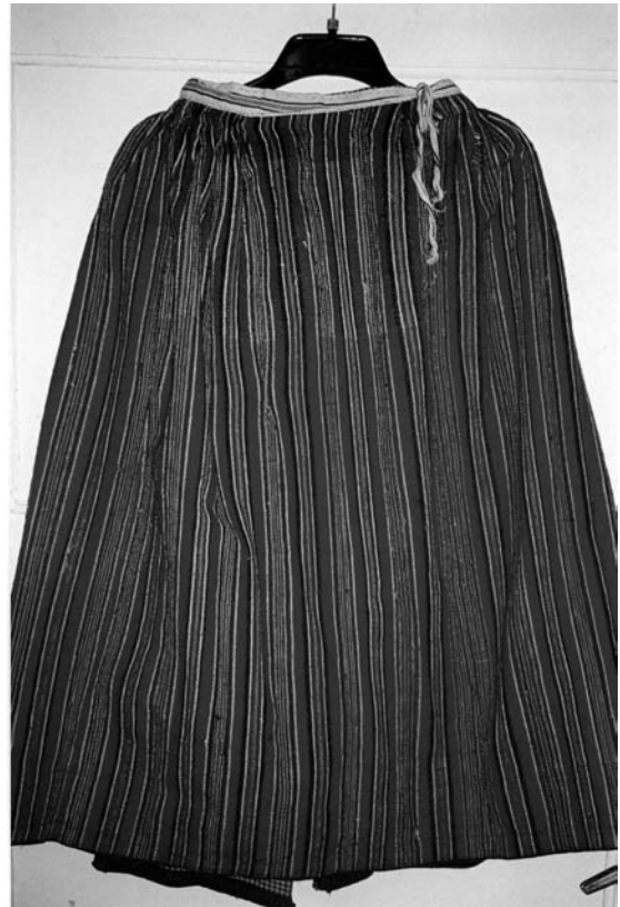
Спідниця, 1920-ті рр. с. Берестя Дубровицького району Рівненської обл. Льон, вовна; полотняне ткання. МНАПЛ. АП-15417.

Художнє вирішення тканин для спідниць тісно пов'язаний з багатьма іншими компонентами одягу (сорочками, запасками, хустками, безрукавками, крайками тощо). Місцезорозташування декору, його величина, кольорові співвідношення, а також техніки виконання, структура й фактура тканин для спідниць та інших виробів взаємодоповнювалися, узгоджувалися й творили цільний художній ансамбль. У ньому не було нічого випадкового, зайвого й нераціонального, усе досконало вивірено, продумано та підпорядковано загальному комплексу традиційного вбрання.