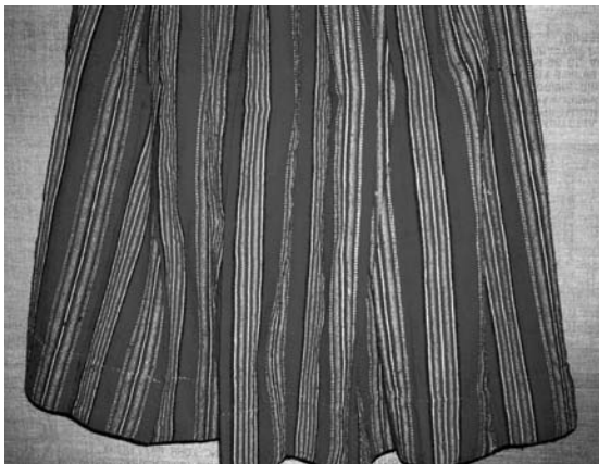
Спідниця “літник”, 1920-ті рр. с. Кухли Меневицького р-ну. Льон, вовна; полотняне тканиня. ВКМ. Д-930.