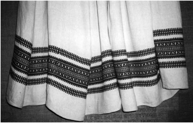
Спідниця “фартух” (фрагмент), 1930-ті рр. с. Нуйно Камінь-Каширського р-ну Волинської обл. Льон, бавовна; полотняне й перебірне тканиня “під дошку”. Волинський краєзнавчий музей (далі – ВКМ). Р2-1877.