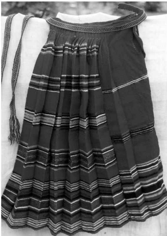
Спідниця "бурка", кін. XIX – поч. XX ст. с. Залісся Ратнівського р-ну Волинської обл. Льон, вовна; сатинове тканиня.

на відстані 8 см від подолу й акцентують доволі монотонну ритміку по вертикалі.