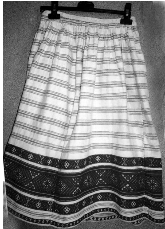
Спідниця “літник” (фрагмент), 1920-30-ті рр. с. Тур Ратнівського р-ну Волинської обл. Льон, бавовна; саржеве, перебірне ткання “під дошку”. Музей Івана Гончара (далі – МІГ). КТ-11119.