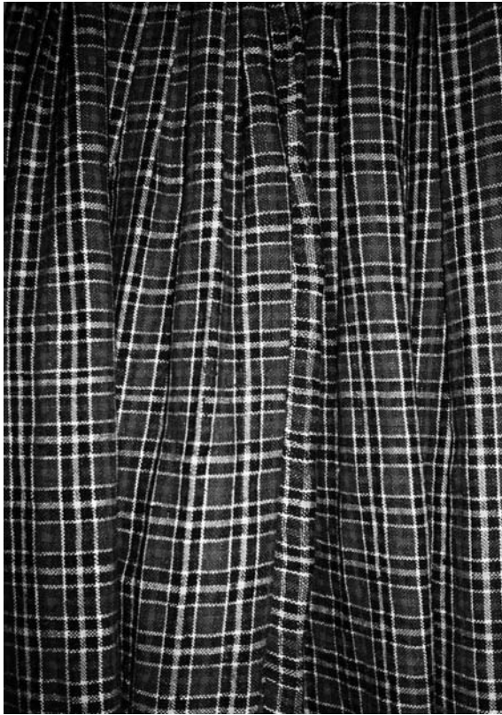
Спідниця, 1950-ті рр. с. Любохини Старовижівського р-ну Волинської обл. Льон, полотняне тканиня. ВКМ. Д-1041.