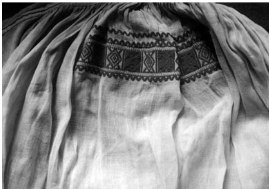
Спідниця “сукня” (фрагмент), кін. XIX – поч. XX ст. с. Крупів'є Дубровицького р-ну Рівненської обл. Льон, бавовна; полотняне й перебірне тканиня “під дошку”. Рівненський краєзнавчий музей. Т-2380.