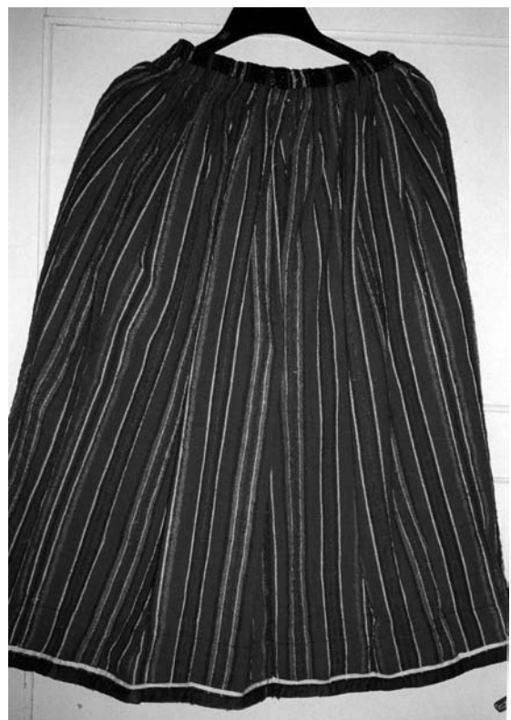
Спідниця, 1920-30-ті рр. с. Здомишель. Льон, вовна; полотняне ткання. МНАПЛ. АП-18488.