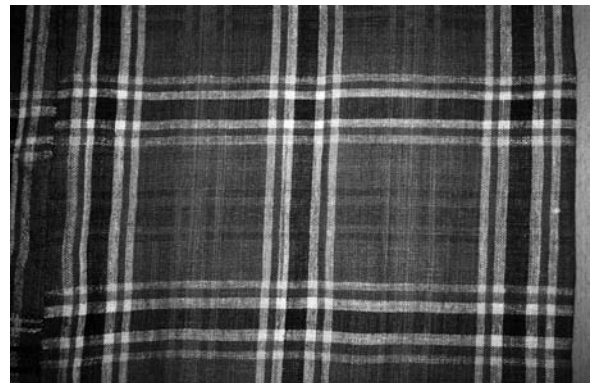
Спідниця (фрагмент), 1950-ті рр. с. Любохнини Старовижівського р-ну Волинської обл. Льон, полотняне тканиня. ВКМ. Д-1040.