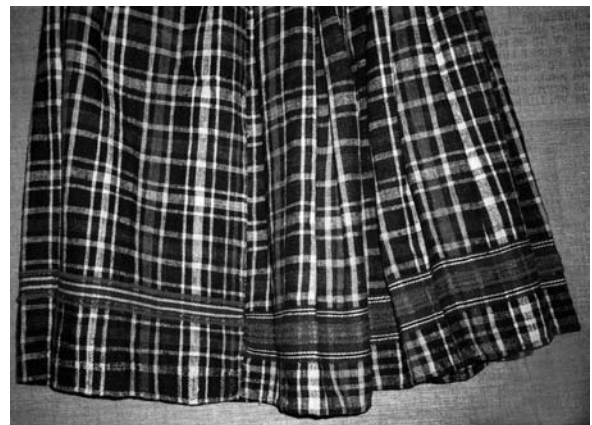
Спідниця (фрагмент). Автор Бідун Ганна Степанівна 1950-ті рр. с. Воропілля Камінь-Каширського р-ну Волинської обл. Льон, полотняне, репсове тканиня. ВКМ. Д-1087.