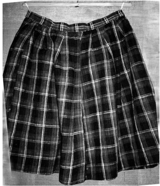
Спідниця “літник” (фрагмент), поч. ХХ ст. с. Острів Камінь-Каширського р-ну Волинської обл. Льон, полотняне тканиня. ВКМ. Д-187.

Аналогічна схема розташування кольорових смуг з “обмітками” характерна й для інших осередків ткацтва досліджуваного регіону (с. Кричинськ, Сарненського р-ну). Ширина цих різнокольорових стрічок така ж, як і проміжки синього тла між ними. Але завдяки різниці в тональних співвідношеннях й додатковому введенню тоненьких стрічок “обміток” досягнуто більшої різноманітності в ритміці їхнього чергування – послідовної зміни неоднакових за масою ширших і вузьких пасочків. Загалом найсвітліші білі смуги, розташовані симетрично з обох країв (верхнього та нижнього), вирізняються з-поміж інших і є домінантою композиції. Жовта, центральна поступається білій за тональністю, м’якше узгоджується із зеленими. Рожеві та червоні стрічки значно інтенсивніші, дзвінкіші за інші, тому вони підсилюють звучання білих.