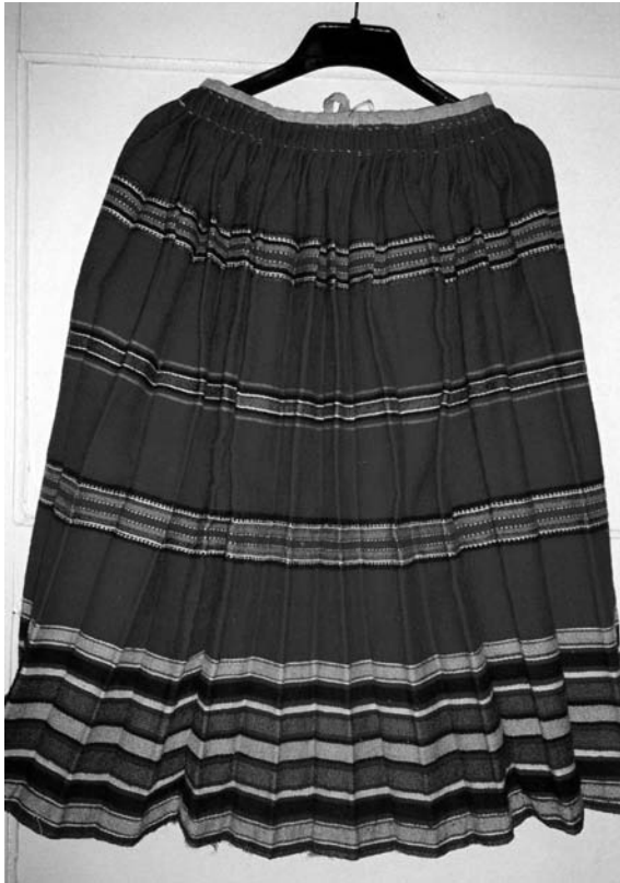
Спідниця, 1930-40-ті рр. с. Тур Рокитнівського р-ну Волинської обл. Льон, вовна; сатинове тканиня. МНАПЛ. АП-18506.