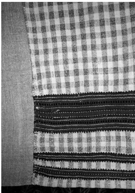
Спідниця (фрагмент), кін. XIX – поч. XX ст. с. Кримне Старовижівського р-ну Волинської обл. Льон, бавовна; полотняне, репсове й перебірне тканиня. Музей народної архітектури й побуту у Львові (далі – МНАПЛ). АП-13974.

ниці) й сприяла плавнішому переходу до нейтрального білого чи сіруватого фону.