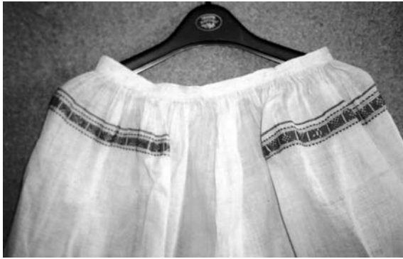
Спідниця “серпанкова” (фрагмент), кін. XIX – поч. XX ст. с. Берестя Дубровицького р-ну Рівненської обл. Льон, бавовна; полотняне й перебірне тканиня “під дошку”. МІГ. КН-6417.