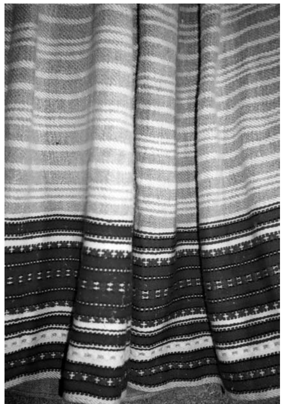
Спідниця, 1920-30-ті рр. с. Любязь Любешівського р-ну Волинської обл. Льон, бавовна; саржеве, перебірне ткання “під дошку”. МІГ. КН-1075.