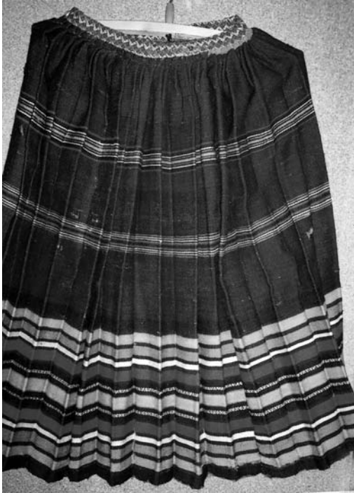
Спідниця “літник”, поч. ХХ ст. с. Ратне Волинської обл. Льон, вовна; сатинове тканиня. МІГ. КН-622.