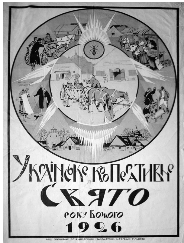
Петро І. Холодний. “Українське кооперативне свято”. Папір, літографія, 99 x 70. Львів, друк. А.Гегедіса, 1926 р. МЕХП інв. ЕП 83360.