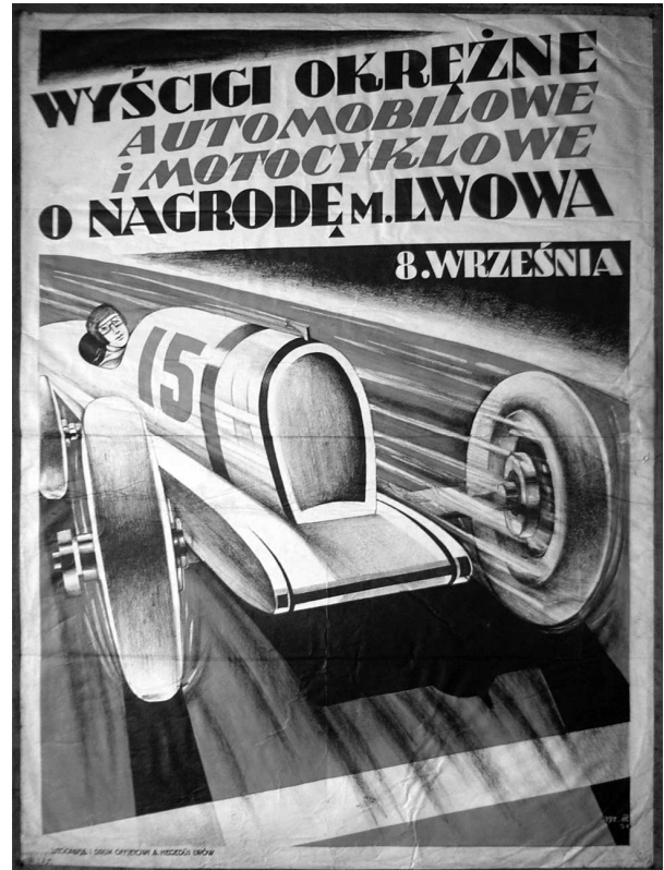
М.А. “Wycigі okresne”. Папір, літографія, 110 x 83. Львів, 1930 р. МЕХП інв. ЕП 62160.

Особливістю плаката, як відомо, є лаконічний текст, що представляє назву фірми, рекламований товар, послуги, фірмовий лозунг тощо. Плакати без тексту малювали дуже рідко: з трьохсот творів (у тому числі 77 з Галичини), які залучені для нашого аналізу, тільки 3% цілком не мали шрифтових елементів (у Галичині таких не вияв-