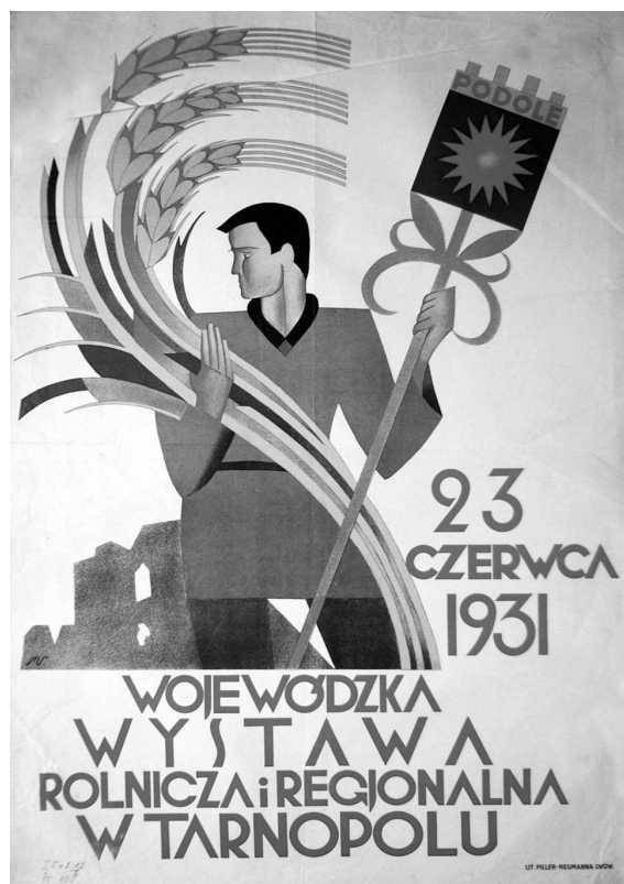
М.С. “Wystawa Rolnicza i Regionalna w Tarnopolu”. Папір, літографія, 100 x 70. Львів, друк. Піллер, 1931 р. МЕХП інв. ЕП 62182/2.