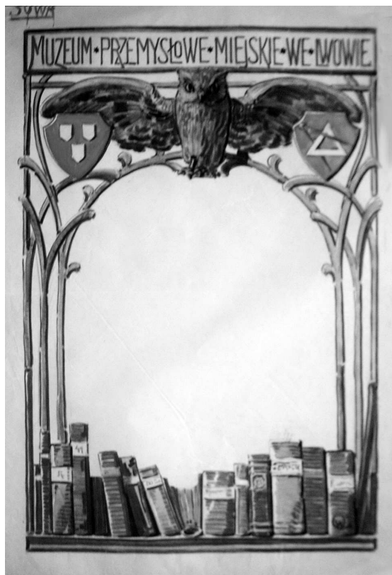
Плакат “Muzeum Przemysłowe Miejskie we Lwowie”. Папір, літографія, 99 x 70. Львів, 1900 р. (?) МЕХП інв. ЕП 61898.

Для туристичної та відпочинкової реклами плакатисти іноді використовували жанр пейзажу, на-