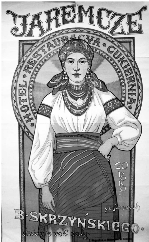
Плакат "Jaremcze". Папір, літографія, 99 x 45. Коломия (?), 1920-ті рр. ЛНБ НАНУ ім. В. Стефаника.