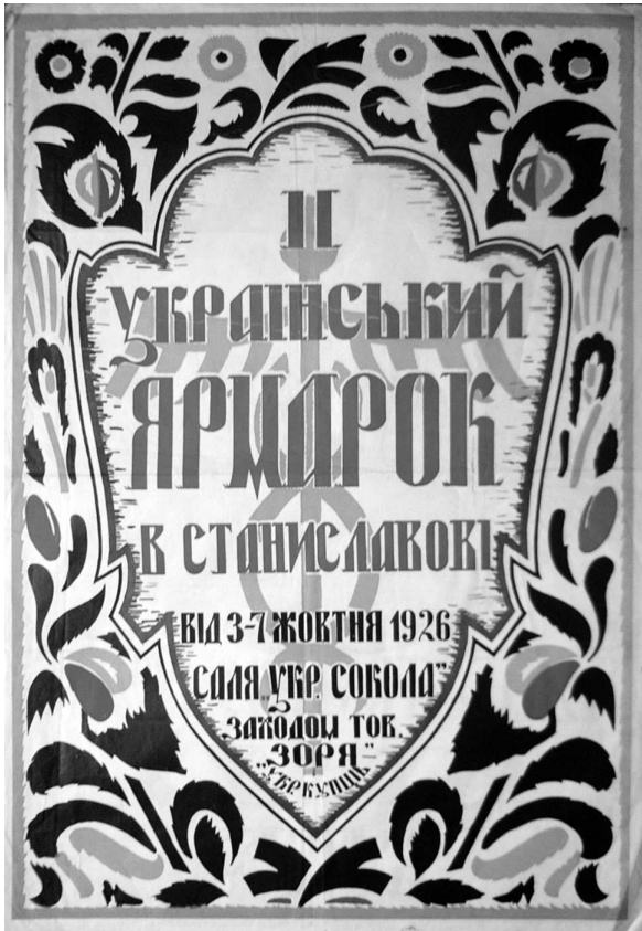
Плакат "Український ярмарок". Папір, літографія, 99 x 67. Коломия (?), 1926 р. МЕХП інв. ЕП 64068.