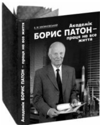
Книга, випущена видавництвом «Наукова думка»

Біографії видатних людей користуються незмінною популярністю у широкого кола читачів. Досить нагадати успіх відомої серії «Жизнь замечательных людей», що була започаткована О.М. Горьким і протягом багатьох десятиліть видавалася в СРСР. Не буде перебільшенням сказати, що книги цієї серії справили значний вплив на виховання кількох поколінь молодих людей. Життя видатних особистостей викликає бажання наслідувати їх приклад, допомагає вистояти під час труднощів, що рано чи пізно виникають у кожної людини. В Україні останнім часом також з'являється чимало книг про наших славетних співвітчизників. У цій короткій рецензії я хотів би поділитися своїми враженнями від щойно виданої книги Б.М. Малиновського «Академік Борис Патон — праця на все життя».