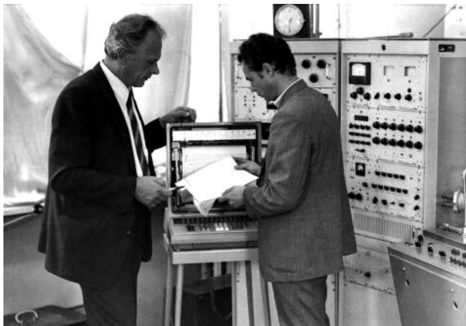
Науковий керівник програми з водневої енергетики директор ШМаш А.М. Підгорний під час експериментальних досліджень

У 1995 р. А.М. Підгорного обирають дійсним членом Національної академії наук України за фахом «енергетичне машинобудування». За заслуги у розвитку науки і підготовці кадрів у 1984 р. він був нагороджений орденом Дружби народів, а в 1992 р. одержав почесне звання Заслуженого діяча науки і техніки України.