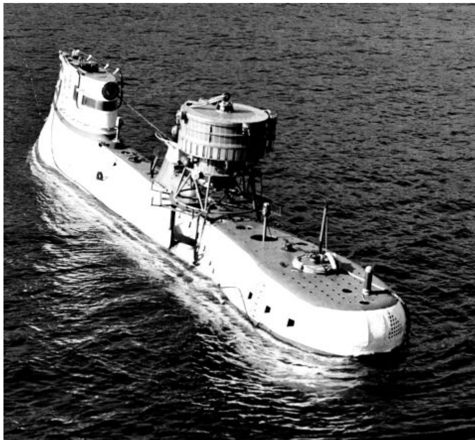
Автономний глибинний підйомний пристрій АПП-1

Вчений з широким кругозором, талановитий організатор, Анатолій Миколайович постійно шукав нові форми організації досліджень. Він ініціював створення галузевих лабораторій подвійного підпорядкування, внутрішньоінститутські комплексні довгострокові програми із сітьовим графіком їх виконання, наскрізне планування робіт у ланцюгу «інститут — конструкторське бюро—виробництво» тощо. У 1990 р. учений бере участь у заснуванні Інженерної академії СРСР, яка пізніше набуває статусу міжнародної. У 1991 р. його зусиллями створюється Українське республіканське відділення. Згодом воно перетворюється на Інженерну академію України, а А.М. Підгорний стає її першим президентом. Поява такої громадської організації в Україні дала можливість ефективніше використовувати науково-технічний потенціал, підвищити результативність прикладної та заводської науки, інженерної діяльності, пристосуватися до нових умов, особливо у скрутний для виживання науки час, який настав після 1991 р.