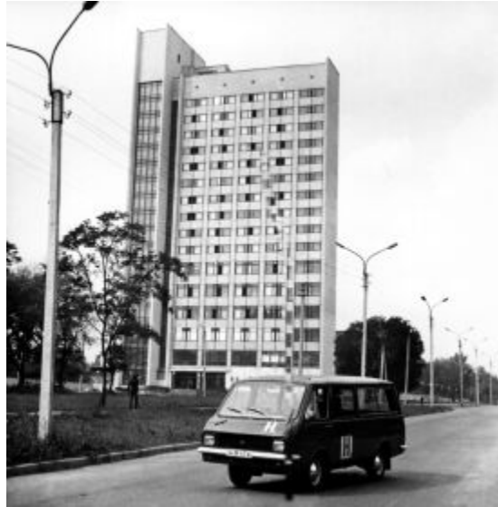
Інститут проблем машинобудування ім. А.М. Підгорного