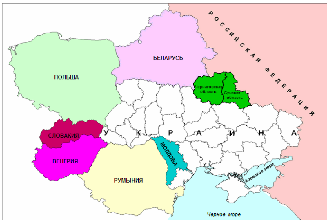
Рис. 2. Черниговская и Сумская области Украины в системе регионов Украины и соседних стран Восточной Европы

Важной чертой украинского приграничья является его неоднородность. Существующие различия носят как социально-экономический, так и естественно-географический, этнический, социально-культурный характер. Черниговская и Сумская области, взятые в качестве примера нового «постсоветского приграничья», обладают уникальным геополитическим положением ( рис. 2 ), природно-ресурсным и человеческим потенциалом, что в целом формирует характерные черты качества жизни населения. Более того, эти черты во многом подобны приграничным регионам соседних государств.