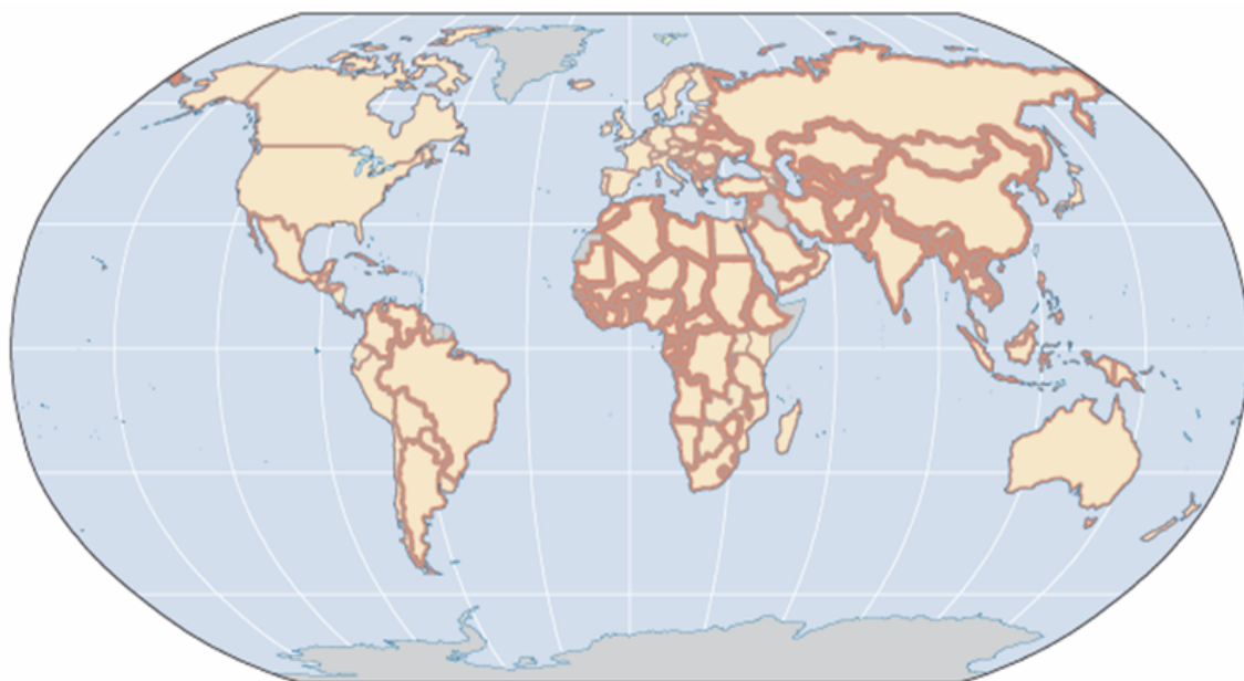
Рис.1. Границы в некоторых странах мира «прозрачнее» других. (Толщина линий пропорционально суммарному количеству ограничений при пересечении границ стран (товары, капитал, люди, информация))

Из данного документа вытекают факторы, лежащие в основе экономической интеграции. Она означает, с одной стороны, интеграцию сельских районов и городов, интеграцию трущоб и других городских районов. То есть речь идет об урбанизации в ее качественном смысле. С другой стороны, речь идет об интеграции отсталых и успешных регионов в пределах одной страны. Наконец, на международном уровне важна тесная интеграция как между изолированными, так и тесно связанными экономически, социально и политически странами. Вот тут ключевая роль отводится границам и развитию приграничных регионов – как контактных зон и центров формирования способа, уровня и качества жизни особого, т.наз. «приграничного» типа.