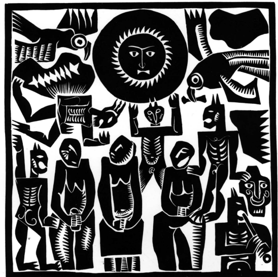
Богдан Сорока. Кам'яні баби. 1969. Ліногравюра.

Він довго переживував вірш “Кам'яні баби” Калинця. В кінці сказав, що якби я нарисував радянську зірку проколоту штиком, то це був би явно антирадянський рисунок”.