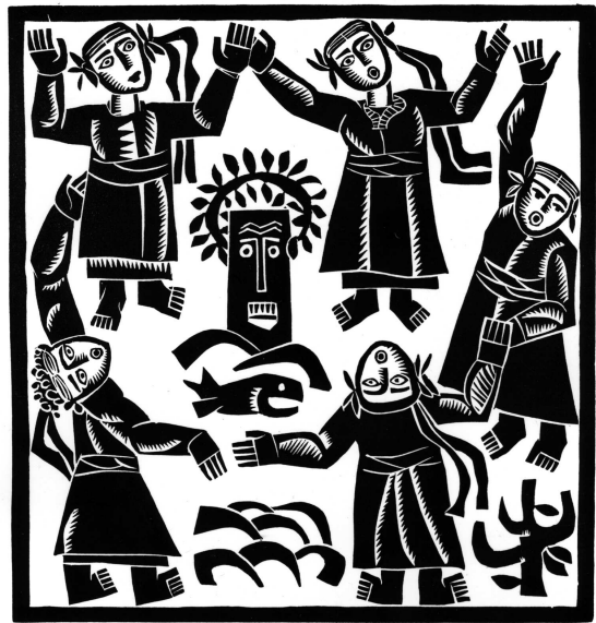
Богдан Сорока. Топлення морени. З циклу “Фольклорні мотиви”. 1968. Ліногравюра.

розом, що зацітував Лесю Українку, яка писала, що “це не мої боги”, коли побачила поганського бога, створеного молодим ще тоді російським скульптором Коненковим. Зібрані по краплинах художником відомості про поганських богів дали йому можливість констатувати, що українські поганські боги були добрі, їх не боялися і на них можна було насварити, якщо вони щось зробили не так. Цей цикл було названо “Українська міфологія”. Із розповідей художника довідуємось, що ці гравюри потрапили на Захід, художник передав їх Вірі Вовк, що перебувала тоді у Києві, і вона їх перевезла.