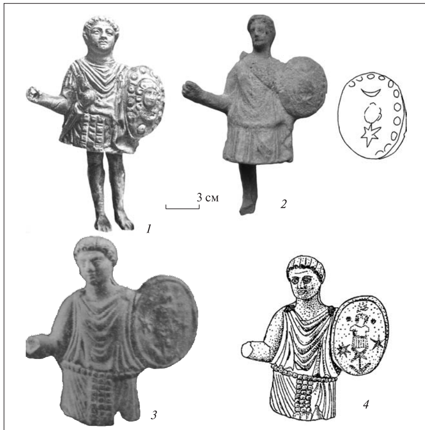
Рис. 1. Статуетки: 1 — Ольвія (за: Леви 1970); 2 — пункт невідомий; 3, 4 — Козирка (за: Бураков 1988; Буйских 1991)

Ще одна статуетка такого самого типу була знайдена в Криму та опублікована в каталозі теракот музею Мартіна фон Вагнера м. Вюрцбург (Schmidt 1994). Зображення на щиті аналогічне описаному. Висота 13,6 см (рис. 3, 1).