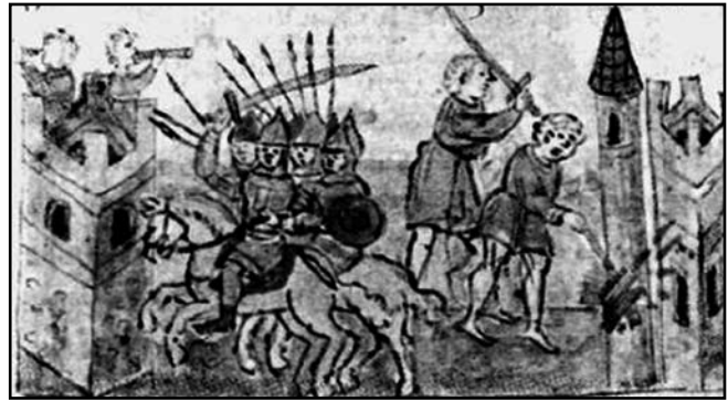
Напад половців на Київ. 1096 р. Мініатюра з Радзівілівського літопису

Взимку 1237-1238 рр. татаро-монголи, узявши Москву, «... город и церкви святыя предали огню, и все монастыри, и села пожгли...» [35, 196]. На початок лютого 1238 р. полчища хана Батия спопелили Рязань, Пронськ, Коломну, Москву й інші міста Рязанської і Владимир-Суздальської землі. Узявши і розграбувавши великокнязівський Владимир-на-Клязьмі, 7 лютого 1238 р. монголи підпалили його; згоріла його дерев'яна фортечна огорожа [36, 58]. У 1239 р. вони захопили Чернігів і «... зажгли его огнем» [37, 245, 273]. Батий повністю