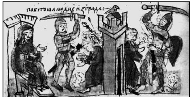
Взяття Іскоростеня Ольгою. Мініатюра з Радзівілівського літопису

від плану сторони, що нападала, – штурмувати укріплення в одному або декількох місцях, а можливо, відвернути вогнем увагу обложених від ділянки дійсної атаки. У 1146 р. нападники підпалили Галич в трьох місцях , його захисники зуміли відбити штурм [15, 157]. При штурмі головного міста камських болгар Ошеля в 1220 р. за словами літописця: «... а наперед шли пешцы с огнем и с топоры, а за ними стрельцы, копейщики... оплот пожгоша... Потом к граду приступиша, звідсіля зажгоша его, и бысть буря и дым велик на сих потяну...» [16, 42].