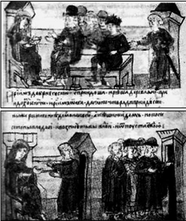
Прийм Ольгою древлянських послів. Мініатюра з Радзівіллівського літопису