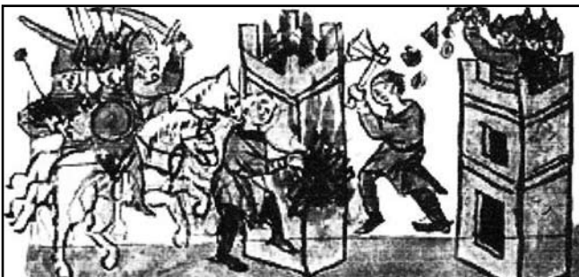
Князь Володимир Мономах штурмує Чернігів.

Дуже часто на початку облоги спалювався острог – окремо розташоване поза містом або фортецею укріплення. У 1146 р. Всеволод Ольгович спалив острог поблизу Звенигорода. Острогом у літописах називають також власне огорожу