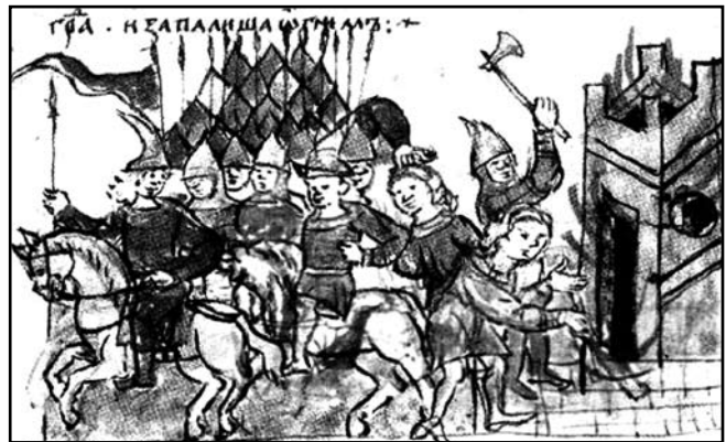
Половці захоплюють Торческ. 1093 р. Мініатюра з Радзівілівського літопису

зруйнував і спалив Колодяжин [38, 274-276], Ізяславль [39, 276-277], у 1240 р. – Переяславль і Ярославль. Після татаро-монгольського нашествия Русь лежала в згарищах і руїнах.