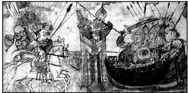
Облога русами Царьграда з моря. Мініатюра Радзівіллівського літопису

зазвичай з метою оволодіння фортецею, добре забезпеченою як гарнізоном, так і продовольством. Дії обложників зводилися до того, щоб просуватися вперед хоча і повільно, але з можливо меншими втратами. Досягалося це шляхом послідовного знищення засобів оборони із застосуванням різних заходів і пристосувань для прихованого, забезпеченого від поразки підходу до стін фортеці. Засобами для цього служили різні машини – металеві, руйнівні і підступні.