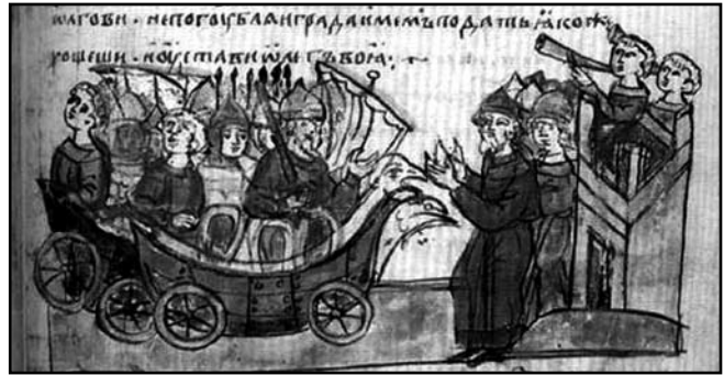
Облога князем Олегом Царьграда. Мініатюра Радзівіллівського літопису

Поступова атака, або облога , застосовувалася