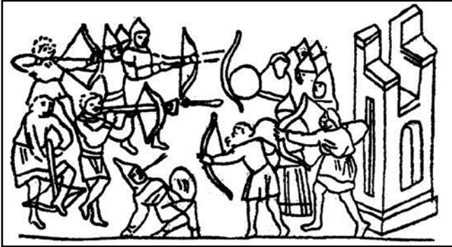
Бій біля стін міста.