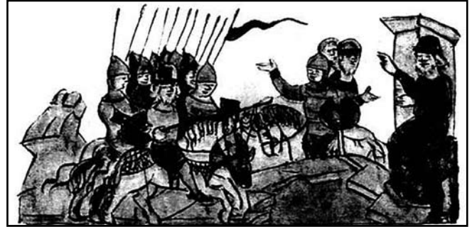
Битва біля м. Любеча.

З'явилися круглі в плані фортеці, хоча і невеликі, але розраховані на кругову оборону. До того існувало розділення на фронтальну, найбільш укріплену частину, і тилу частину укріплення, що спиралося на природні перешкоди (річки, яри тощо). Круглі фортеці створювалися з більшою свободою щодо рельєфу місцевості. У Південній і Південно-