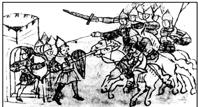
Штурм воріт міста кіннотою противника. Мініатюра Радзівілівського літопису XIII (XV ст.)

дослідження усіх складових його алгоритму – від рекогносцировки до поховання загиблих. Ця тема давно «дозріла», щоб стати дисертаційним, а згодом і монографічним дослідженням. Проте братися за неї варто людям, які мають відповідні освіту, підготовку і знання засад фортифікації й тактики хоча б в елементарному обсязі.