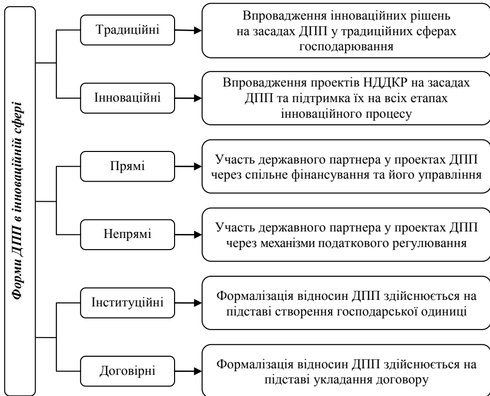
Рис. 3.2. Базові форми ДПП в інноваційній сфері (Розробка автора)

контракти на виконання робіт та надання суспільних послуг; контракти технічної допомоги; контракти на управління. До концесійних – лізинг, угоди на розподіл продукції та концесії. Окремою формою партнерств розглядаються акціонування та спільні підприємства, які мають безліч типів залежно від ступеня участі держави, організаційних форм і т. д. [4, с. 32].