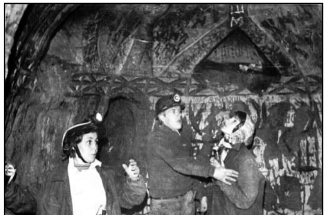
Обстеження каплиці членами спелеоархеологічної секції УТОПІК. Фото 1970 р.

Щодо питання часу заснування так званих Аліпіївих печер, то і тут не все до кінця зрозуміле.