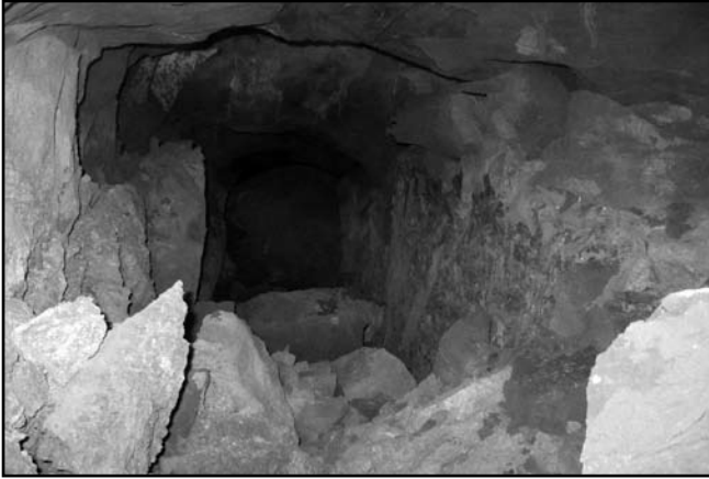
Сучасний стан Аліпіївських печер. Фото 2010 р.

По-перше, чому Аліпій розпочинає створення нового печерного комплексу, коли у його розпорядженні були не тільки широковідомі Антонієві печери, але й великі підземні споруди, розташовані з протилежного боку Іллінського яру (сучасна назва «Новоантонієві печери»)? По-друге, чому не відбулося урочистого акту освячення початку робіт?