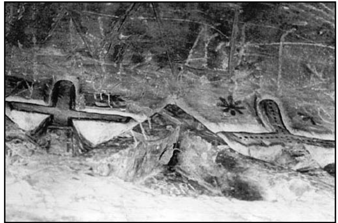
Фриз ходу «Омофор». Фото 1970 р.

За офіційною версією, загинув священник О. Яковенко у 1943 р. від вибуху німецького снаряду під час визволення села бійцями Червоної Армії. До речі, у 1989 р. під час опитування старих мешканців с. Ульянівка (колишнє с. Свинь), автори статті почули і побачили чимало цікавого: довідалися про те, що сам Аліпій підкреслював в розмовах зі своїми прочанами, що був рукопокладений у сан священника особисто Іоанном Кронштадтським; знайшли і підтвердження того, наскільки амбіційною людиною був Олександр Яковенко. Це ікона «Святий Аліпій Стопник», образ на якій написаний з Аліпія (Яковенко). З'ясувалося, що коли почався артобстріл, Яковенко наказав своїм черниціям сховатися у печері, а сам, чомусь, побіг в іншій бік і вліз у водостічну трубу під дорогою, де його і накрив снаряд. Виходячи зі спогадів старих мешканців Ульянівки, на місці загибелі Аліпія знайшли тільки його чобіт, який і поховали. Але чим пояснити те, що на цвинтарі біля церкви знаходяться аж дві його могили? До