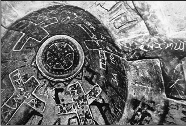
Художнє оздоблення склепіння каплиці. Фото 1970 р.

Б. Пилипенком, який пише, що після того, як 25 листопада 1919 р. печери були освячені Чернігівським єпископом Пахомієм, роботи у них повністю припиняються. Не довіряти інформації, яку оприлюднив автор – професійний історик і практично сучасник подій, не доречно. Важко ставити під сумнів і свідчення Максима Клодька, бо названа їм дата (1922 р.) пов'язана з конкретними подіями його життя, так що помилитися він не міг: в 1921 р., по захворюванню, Клодько звільняється з лав Червоної Армії, приїздить у Чернігів і працевлаштовується на залізницю. Причину розбіжності зазначеної інформації знаходимо у тих же свідченнях. Справа в тому, що Б. Пилипенко говорить про офіційні етапи історії створення печерного комплексу, тобто про початок робіт та ритуал освячення «Нової» підземної культової споруди єпископом Пахомієм, які не були таємницею для широкого загалу віруючих. І це цілком природно, бо початок будівництва припадає на період гетьманату та Директорії, який тривав у Чернігові з 12 березня 1918 р. до початку 1919 р. Як відомо, Павло Скоропадський виявляв інтерес до церковних справ і намагався вирішувати їх, не виходячи за канонічні межі. Інша ситуація склалася після встановлення Радянської влади, яка розпочала активну боротьбу з Церквою.