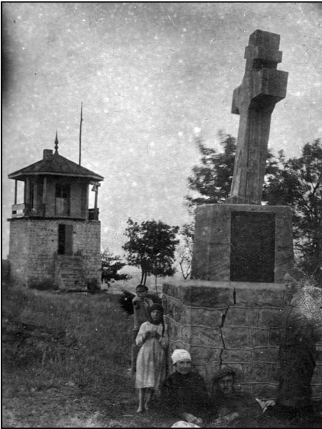
Хрест-пам'ятник на Замковій горі. 30-ті роки XX ст.

встановили древній герб міста. Під час коронного сейму у Варшаві 15 жовтня 1592 р. Сигизмунд III видав Чигирину новий привілей, який дозволив самоврядування за Магдебурзьким правом. Цією ж грамотою також було затверджено «печать мисткую герб – три стріли», яку міщани та їхні нащадки мають використовувати «до одправовання справ містких» [2, 55]. Після ухвалення чотирилітнім сеймом реформаційних законів про міста в Речі Посполитій, розпочався процес підтвердження давніх міських привілеїв. Такий «диплом» [3, 56] короля Станіслава-Августа встановлено 16 квітня 1792 р. й для Чигирини. У ньому вміщені зображення герба з трьома перехрещеними стрілами, повернутими вістрями вгору. Після остаточного розпаду Речі Посполитої і захоплення Правобережжя Російською імперією Чигирин стає у 1795 р. повітовим містом Вознесенського намісництва, а з 1797 р. – повітовим центром Київської губернії. Починаючи із середини XIX ст., міський герб доповнили губернським знаком (у синьому полі Архангел Михаїл), що мало вказувати на належність міста до Київської губернії. Саме у такому вигляді його затверджено імператорським указом 26 грудня 1852 р. Нижня частина чигиринського герба трактувалася: «...у срібленому полі три навхрест положені стріли» [4, 56]. Колір стріл не зазначено. Цей знак підтверджено указом Сенату від 10 лютого 1853 р.