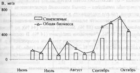
Рис. 2. Динамика биомассы синезеленых водорослей и общей биомассы фитопланктона в оз. Северном летом-осенью 2005 г.

В прибрежных озёрах Байкала снижение их количества было приурочено к понижению температуры воды в конце августа (до 15 °С). Но в то же время, самые высокие годовые значения биомассы отмечены в сентябре-октябре, когда температура снижалась до 6 °С (рис. 2). Интенсивная зимняя вегетация Cyanophyta в прибрежных озёрах вокруг Байкала свидетельствует о том, что температура воды в водоёме – важный, но не единственный фактор, влияющий на их количественные характеристики.