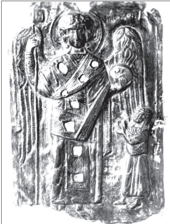
Рис. 7. Херсонес. Архангел Михаїл. Друга половина XI ст. Бронза, карбування. Національний заповідник «Херсонес Таврійський»

йому дійти висновку про солунське походження ікони (Гайдин 1923). Пізніше було знайдено тому ще одне підтвердження, коли стало відоме цілком подібне іконографічно й стилістично зображення св. Дмитрія на серпентиновій чаші того самого часу в скарбниці Сан Марко у Венеції (Банк 1969, рис. 1, 2). Співпадає навіть характерний жест, яким він виймає меча. Подібними засобами здійснено й моделювання рельєфу. Загалом херсонеська ікона з підкреслено видовженими фігурами й ретельно обробленим рельєфом найпростішої орнаментики справляє враження не так реальності, як декоративності. Інакше кажучи, це своєрідний маньєризм, прикладів якого небагато можна знайти серед візантійських творів пластичного мистецтва зазначеної доби. Проте датування обох витворів може бути не остаточним, якщо згадати, що чаша була спершу датована XII—XIII ст.