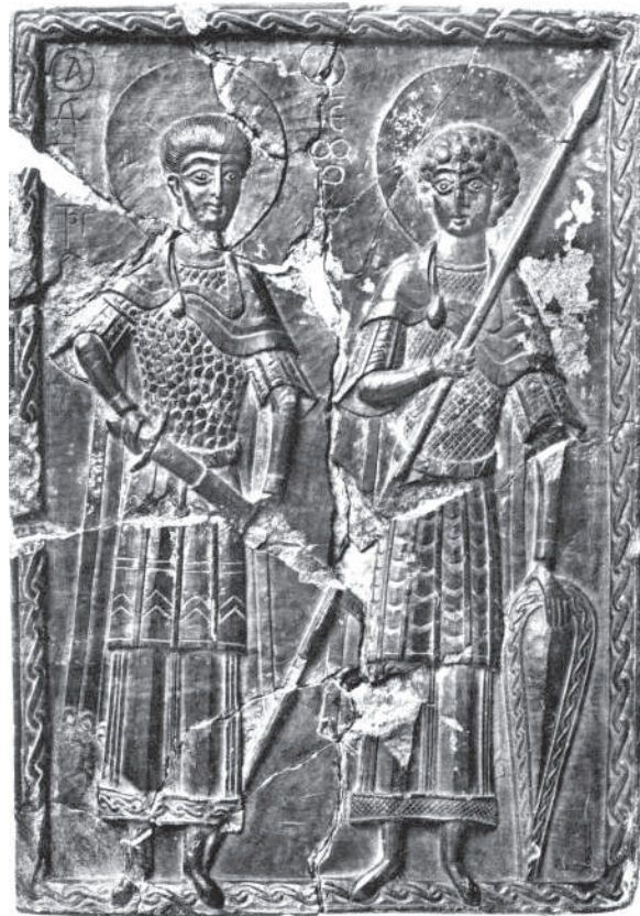
Рис. 6. Херсонес. Св. воїни Георгій та Дмитрій. XI—XII ст. Сланець, різьблення, поліхромія, позолота. Санкт-Петербург, Ермітаж

Значно простіша за композицією стеатитова з поліхромією та позолотою різьблена ікона св. воїна (8,0 × 6,1 см) знайдена у двох фрагментах (без нижньої частини) у XXV кварталі на північному березі 1932 р. (Искусство... 1977, II, с. 113, № 614; Kalavrezou-Maxeiner 1985, р. 107, pl. 11, № 15; Византийский Херсон... 1991, с. 85, № 84). Зображення без супровідного напису, і його визначають як Дмитрія або Георгія (рис. 4, 2). Зачіска, здавалося б, схиляє до останнього варіанту, хоча іноді подібно зображують і Дмитрія, щоправда озброєного мечем, а не списом. Уявлення про характерність подібної манери виконання спричинило до датування ікони XI ст., незважаючи на розвинений комнінівський стиль, що змушує вважати