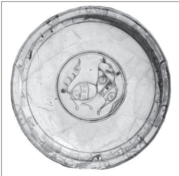
Рис. 9. Херсонес. Блюдо. XII ст. Глина, полива. Санкт-Петербург, Ермітаж

Круглі заглибини для ікон-медальйонів мармурового архітрава вівтарної огорожі XI ст. в церкві преп. Луки на острові Евбея (Лазарев 1967, с. 175, рис. 9) дозволяють визначити функціональне призначення бронзової карбованої з позолотою (діаметр 18,0 см) ікони з погруддям Христа Пантократора, знайденої 1932 р. у північній частині Херсонеса разом з кам'яною іконою св. Георгія (рис. 4, 2; Белов 1941, с. 249, рис. 78—79; Банк 1978, с. 66, рис. 53). Отвори від цвяхків указують, що пластина була закріплена на дерев'яній основі (рис. 8). Рельєфне зображення виконане вміло, з застосуванням різця. Погрудне зображення Христа Пантократора з закритим кодексом у руці, який благословляє правицею, що ніби виходить із бриж гіматію, набуває поширення у візантійській іконографії XI ст. За нумізматичними даними, період його найбільшої популярності припадає на час правління Константина VIII (1025—1028), але цим не обмежується, на що вказують камеї XI—XII ст. Правильний, дещо підкреслено графічний малюнок херсонеської знахідки, з каліграфічним відтворенням пасм волосся і тонких бриж одягу радше може свідчити на користь XII ст.