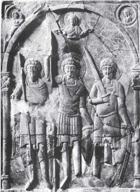
Рис. 5. Херсонес. Св. воїни Феодор, Георгій та Дмитрій. XII ст. Стеатит, різьблення, поліхромія, позолота. Національний заповідник «Херсонес Таврійський»

ком вірогідно, що образок міг прикрашати середохрестя процесійного хреста. Подібні приклади відомі, хоча з карбованими зображеннями, і вони не виключають, що цей образ могли доповнювати ще зображення Богородиці та Іоанна Предтечі на кінцях поперечної перекладини хреста, утворюючи разом дійсному композицію (Банк 1978, рис. 19, 56).