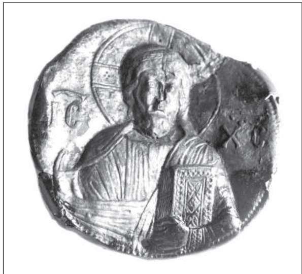
Рис. 8. Херсонес. Христос Пантократор. XII ст. Мідь, карбування. Національний заповідник «Херсонес Таврійський»

11, табл. 1, 16, 17), а деякі стилістичні ознаки наближують її до бронзової ікони Богородиці Одигітрії з собору в Торчело, датованої близько 1200 р. (Кондаков 1915, с. 240—241, рис. 121; Victoria... 1963, fig. 39).