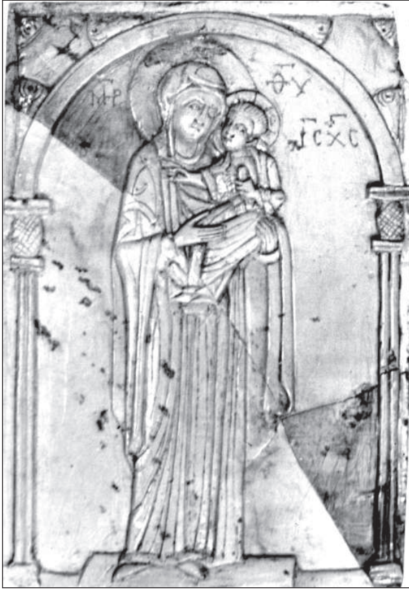
Рис. 3. Херсонес. Богородиця Одигітрія. XII ст. Стеатит, різьблення, поліхромія, позолота. Національний заповідник «Херсонес Таврійський»

рення та відповідність типам, зафіксованим у Константинополі та Коринфі.