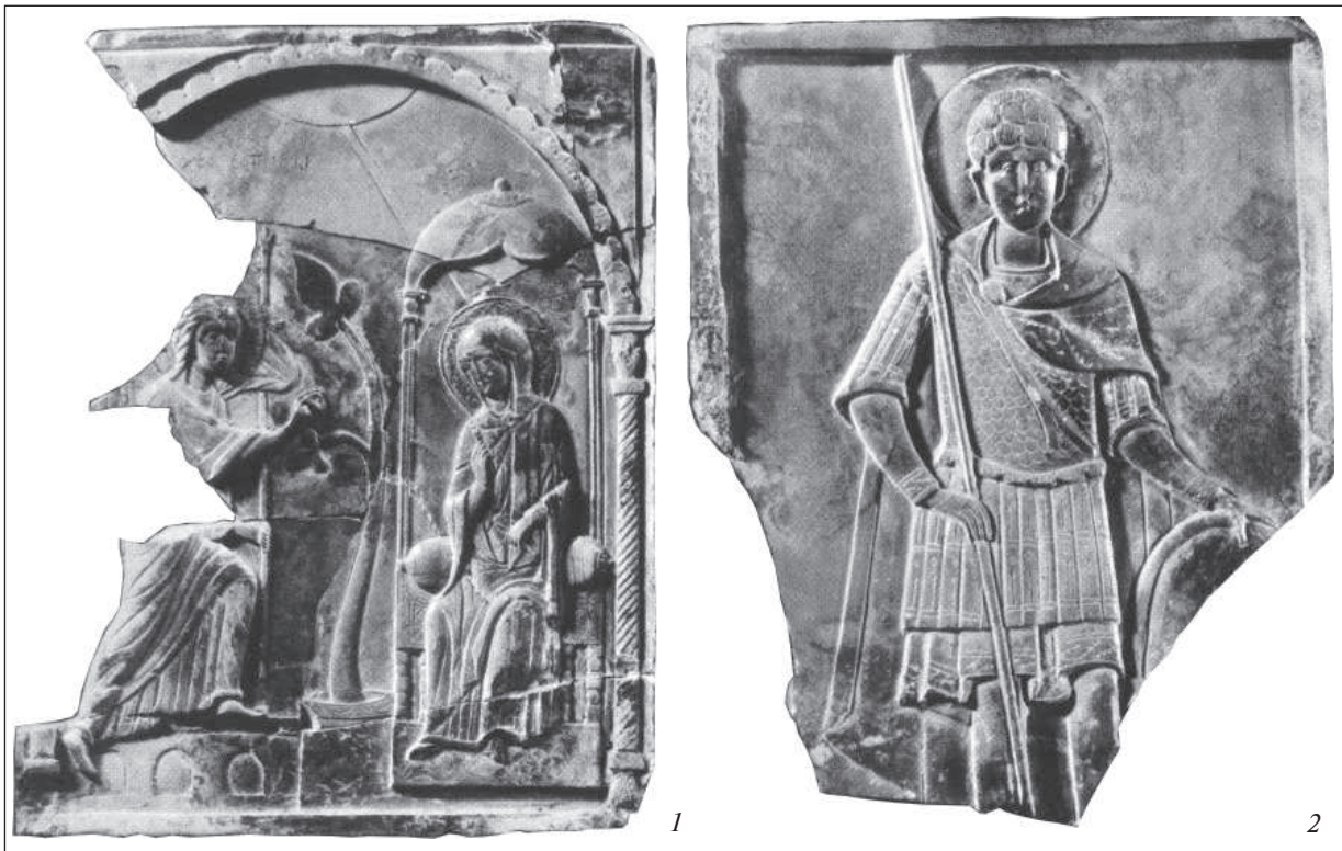
Рис. 4. Херсонес: 1 — Благовіщення. XII ст. Стеатит, різьблення, позолота; 2 — св. Георгій. XII ст. Стеатит, різьблення, поліхромія, позолота. Національний заповідник «Херсонес Таврійський»

мовників і власників таких ікон можна уявити лише серед місцевих найзаможніших осіб, зокрема військових і представників державної адміністрації. Витвори ці надто коштовні.