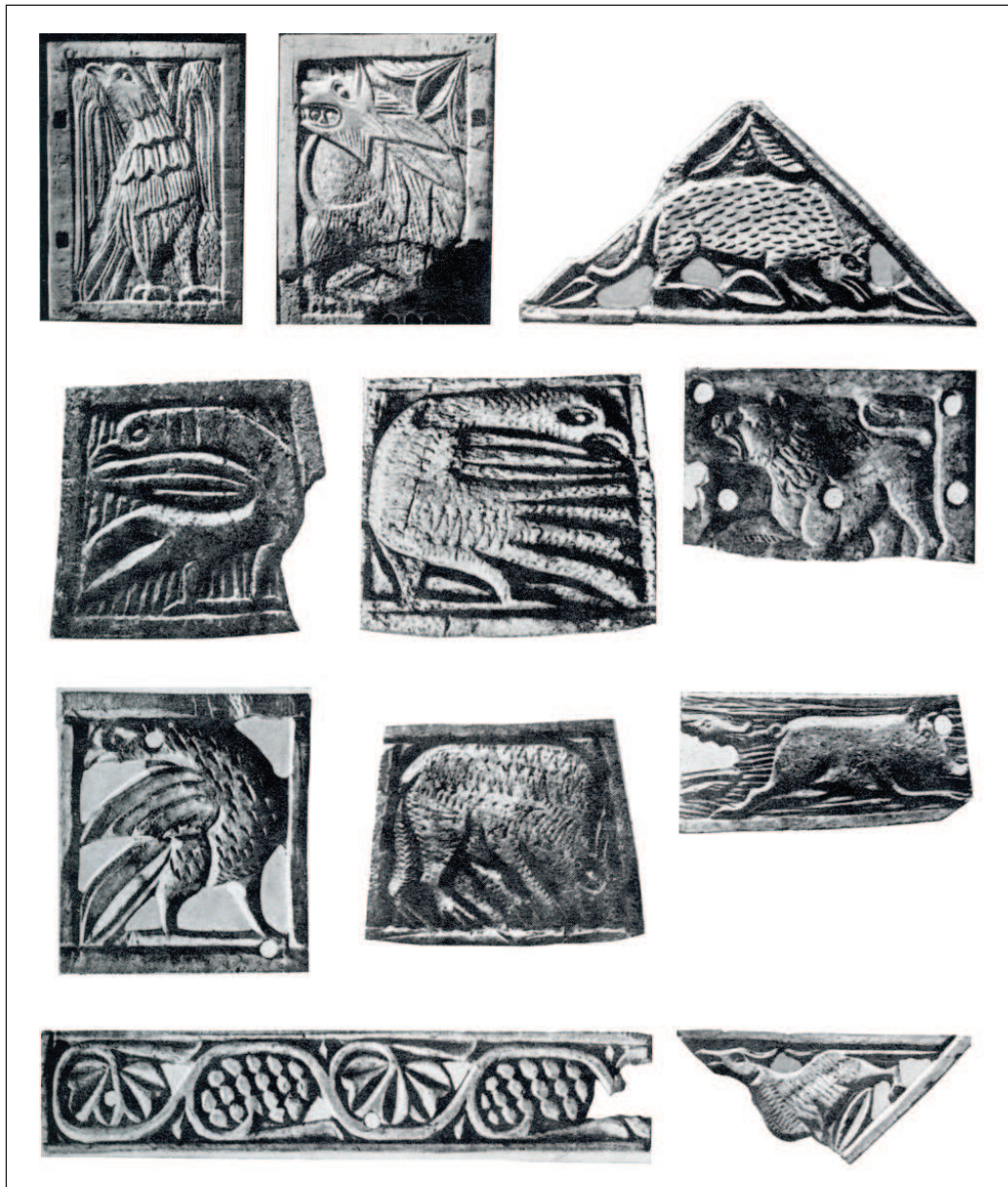
Рис. 1. Херсонес. Кістяні різьблені пластини XI ст. Санкт-Петербург, Ермітаж

Серед ремісничих виробів VI—IX ст. здебільшого трапляються прикраси паска (Айбабин 1982). Наприкінці I тис. у цій галузі помітно посилилися східні впливи, особливо це відобразилося на продукції ремісників Північного Причорномор'я, і лише пізніше відбулася переорієнтація на візантійський стиль (Орлов 1984). Зрештою, цей напрям поширився й значно північніше, сягнувши Києва та Чернігова (Орлов 1984а). То не дивно, адже в X ст. у Києві працювали також східні ювеліри, що засвідчила знахідка ливарної формочки з кувачним написом (Гупало, Ивакин 1980). Отже, якоюсь мірою в Криму наприкінці X ст. міг здійснюватися цей культурний симбіоз, ко-