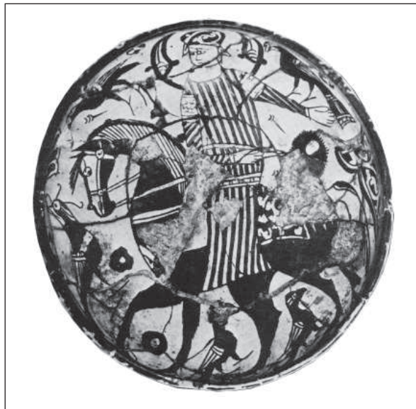
Рис. 12. Херсонес. Чаша. XIII ст. Глина, полива. Санкт-Петербург, Ермітаж