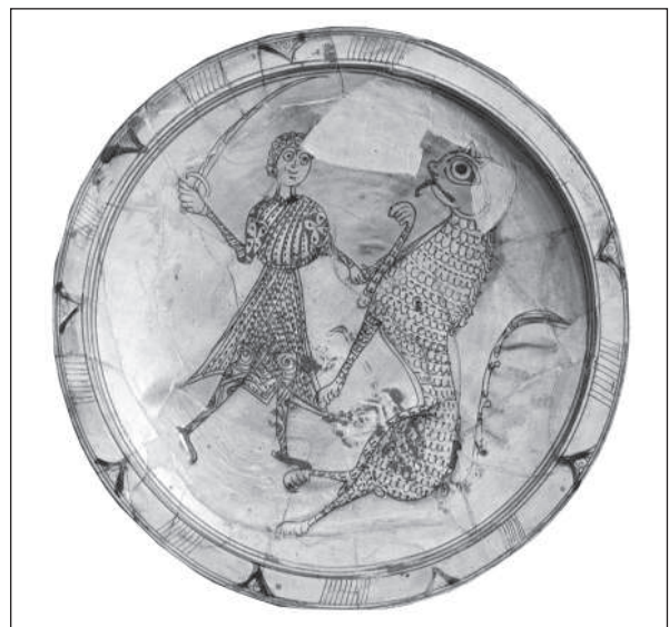
Рис. 10. Херсонес. Блюдо. XII ст. Глина, полива. Санкт-Петербург, Ермітаж

лена статуарність, особливості моделювання рельєфу свідчать про її виконання наприкінці XII або на початку XIII ст. Ікона знайдена у фрагментованому стані (втрачені нижня й ліва частини), тож її розміри були дещо більші. Виконання можна назвати артистичним. Манера дуже відрізняється від властивої попереднім іконам. Вона тяжіє до царгородського кола; виразне й обрамлення у вигляді низки перлів. Зображення Христа Пантократора, який благословляє відведеною рукою, у візантійському мистецтві відоме від XI ст., що, зокрема, засвідчує номісма Ісаака I Комнина (1057—1059), потім з'являється на монетах Алексія I Комнина (1081—1118). Не виключено, що відтворено їхню родинну ікону. Враховуючи те, що херсонеська ікона виявлена ближче до південно-східної стіни храму, біля обгорілого бруса вівтарної огорожі, виказане припущення стає важливим аргументом, тим паче, що за формою та розмірами знахідку можна зіставити з гніздом середньої частини мармурового архітрава XII ст. вівтарної огорожі церкви монастиря преп. Мелетія поблизу Мегари (Лазарев 1967, с. 178, рис. 11). За стилістикою з цим твором можна порівняти знайдену в Херсонесі близько 1896 р. бронзову карбовану позолочену ікону Богородиці Одигітрії (6,8 × 5,0 см) з грецьким текстом молитовного звернення, що заповнює площину частково обламаною обрамлення (Кондаков 1915, с. 248, рис. 130; Искусство... 1977, I, с. 95, № 574). Але постаті тут стрункіші, через що особливо помітні маленькі долоні, що немов губляться серед бриж одягу.