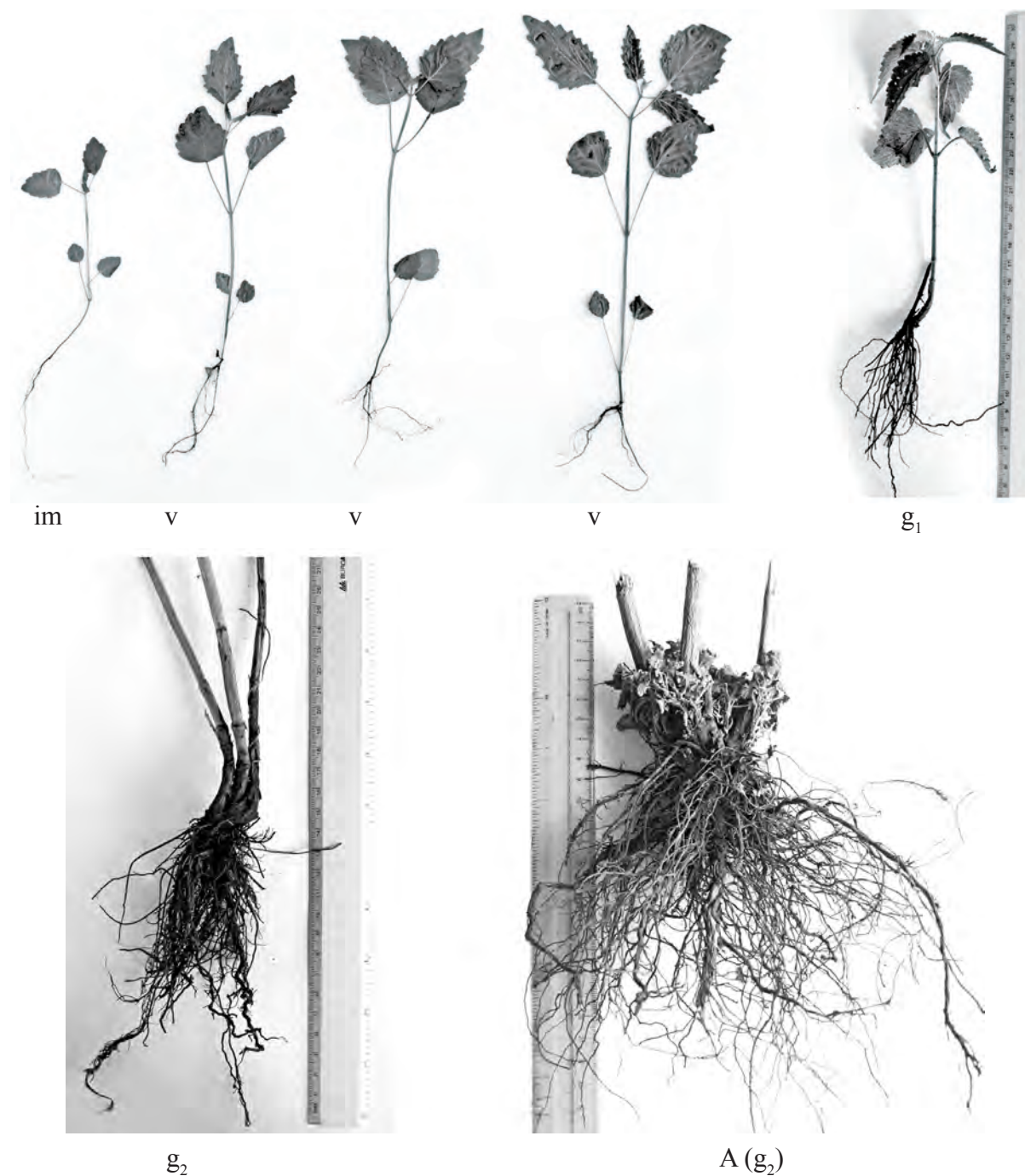
Рис. 2. Корневая система Agastache foeniculum Kuntze. в разные периоды онтогенза: im – имматурное состояние; v – виргинильное состояние; g 1 – молодое генеративное; g 2 – средневозрастное генеративное (возраст 3 года); A (g 2 ) – растение в возрасте пяти лет.

Таким образом, в соответствии с проведенными исследованиями система подземных органов у исследованных видов в условиях интродукции претерпевает определенную модификацию.