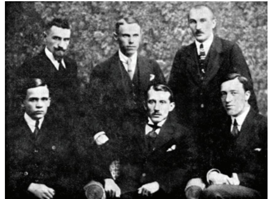
Стрілецька рада. Прага. Липень 1920 р.

Та, очевидно, на засіданні Стрілецької ради було сказано не все, і тому вже на початку серпня 1920 р. у Празі з ініціативи Є. Коно-