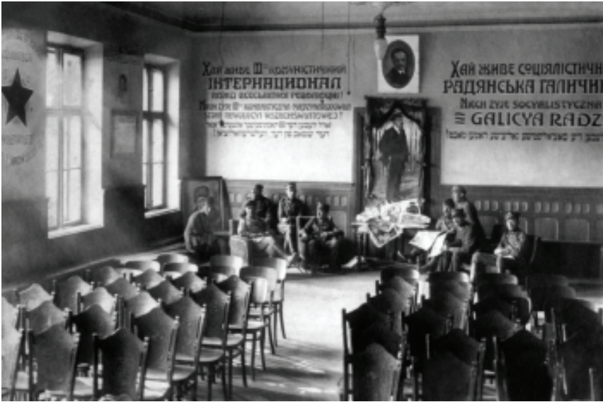
Галицький революційний комітет

армії (ЧУГА) 79 . У захопленому більшовиками Тернополі стояв загін колишніх Українських січових стрільців (УСС), що після квітневого повстання ЧУГА залишились на боці червоних 80 . Більшовики намагались продемонструвати галицькому громадянству, що лише радянська влада може забезпечити українцям Галичини національну державність. І якась частина галицького суспільства, здавалось, повірила в те, що їхнім єдиним союзником у боротьбі з Польщею може бути тільки радянська Росія... Коли наприкінці липня 1920 р. більшовики вступили до Тернополя, делегати міста урочисто вітали їх як «визволителів» від польського ярма 81 .