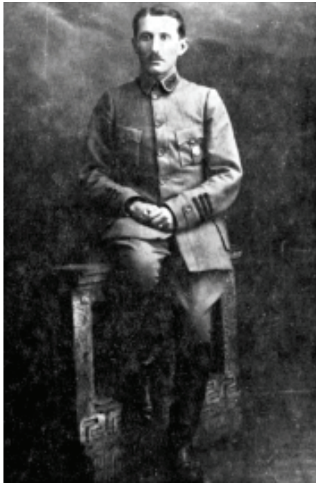
Є. Коновалець. Січень 1920 р.

старшини з джурами. Сплять на цементній підлозі без подстілки. Завдяки переповненню помешкання – в ньому брудно: на чоловіка відпускається одна шістнадцята (1/16) фунта м'яса, жирів на 135 чоловік 2 фунта. Хліб для хворих дуже важкий. Настрій людей: зневірилися в можливість поліпшення стану і майбутнього формування і загальне невдоволення» 34 . Важкі умови таборового побуту деморалізували членів Стрілецької ради. «Народна справа відійшла у поодиноких членів Стрілецької Ради на другий план, а на перший висунулося питання про те, як вийти з того скрутного