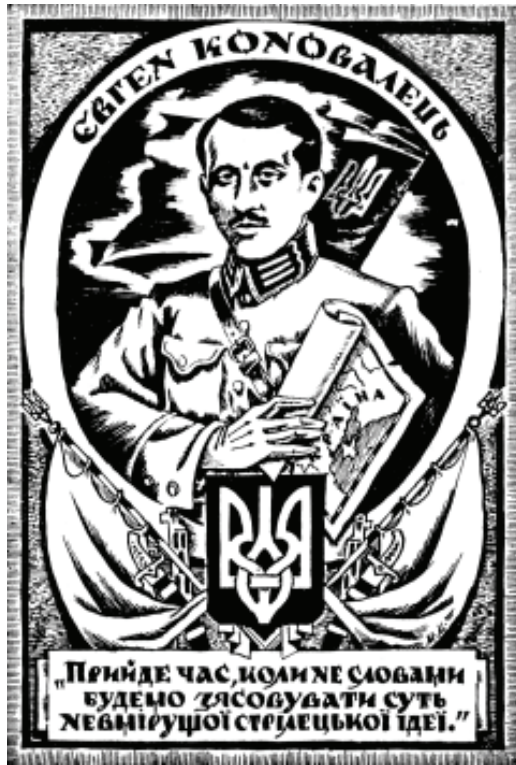
Провідник УВО-ОУН Є. Коновалець. Листівка 1930-х рр.

ціоналістів проголосив «тричі святим все, що відноситься до нашого Вождя» 3 . Певна річ, це не надто сприяло виваженому аналізу військово-політичної діяльності Коновальця в час заснування УВО. Відтак, у діаспорній історичній літературі замість спроб реконструкції й аналізу подій запанували розпливчасті загальні твердження на кшталт того, що Є. Коновалець «підняв прапор боротьби, коли армії вийшли на чужину [...] став на чолі армії підпілля, коли скінчилась боротьба з розгорненими прапорами» 4 .