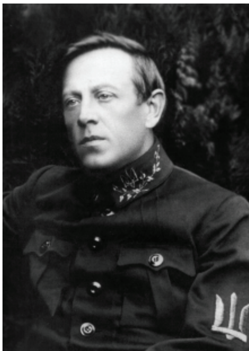
Голова Директорії Головний отаман С. Петлюра

вальця не поінформували про причини виклику. «Вправді не знаю точно, що спричинило цей факт, чи наші листи, які ми висилали в Варшаву і домагалися викликання туди кого-небудь з нас, чи може другі обставини, но сам факт, що Безручко вже їде в Варшаву, буде для нас в своїх наслідках корисним», – писав Коновалець Мельнику 40 . Від'їжджаючи з табору, Безручко, на доручення Стрілецької ради, мав з'ясувати у Варшаві перспективи української справи.