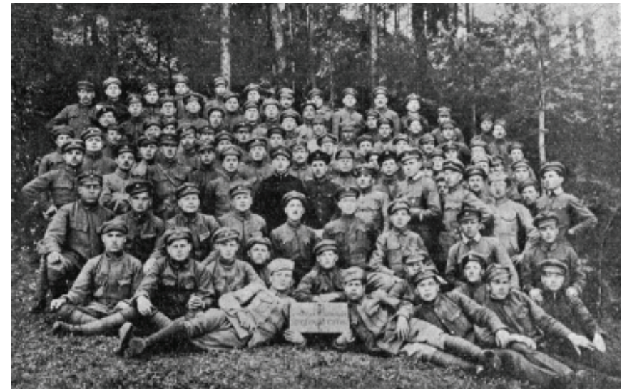
Бригада в Німецькому Яблонному. 1920 р.