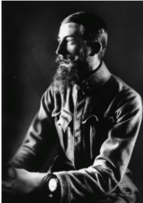
Отаман А. Мельник