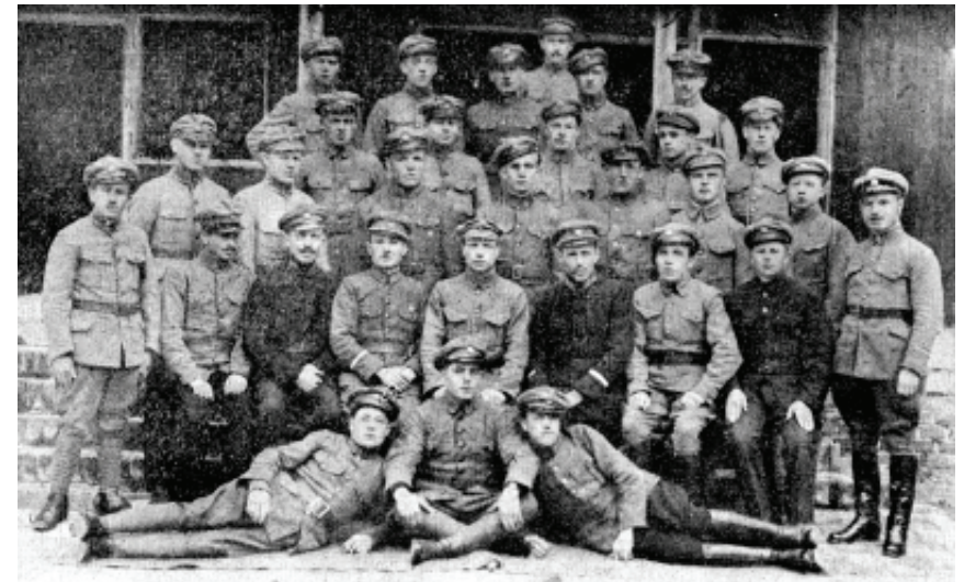
Робітнича сотня в Чехословаччині