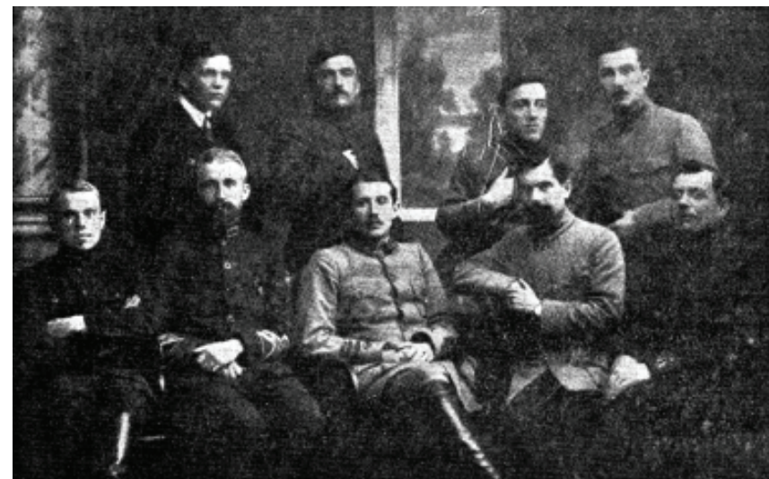
Командування СС після демобілізації. Лютий 1920 р.

бажало компрометувати себе нею в очах галицької громадськості. Водночас, деякі члени Стрілецької ради (підполковники М. Безручко, Р. Сушко) вказували, що участь Січових стрільців у формуванні дивізії дасть їм можливість покинути табір для полонених і, в разі потреби, знову повернутися до збройної боротьби за незалежність України. Зрештою, Стрілецька рада вирішила дозволити усім охочим серед старшин СС долучитися до цієї ініціативи в індивідуальному порядку, зобов'язавши їх, як згадував Коновалець, «не створювати для спільного походу з поляками ніякої січово-стрілецької частини» 42 . Та водночас, уже на початку січня 1920 р. найголовнішим завданням Стрілецької ради було визначено створення закордонного осередку СС, що виконував би роль організаційного центру. З цією метою було вирішено домагатись у Головного отамана С. Петлюри, аби членів Стрілецької ради було звільнено з табору та надано їм право виїжджати за кордон – як свого роду компенсацію за участь у ланцутському формуванні 43 .