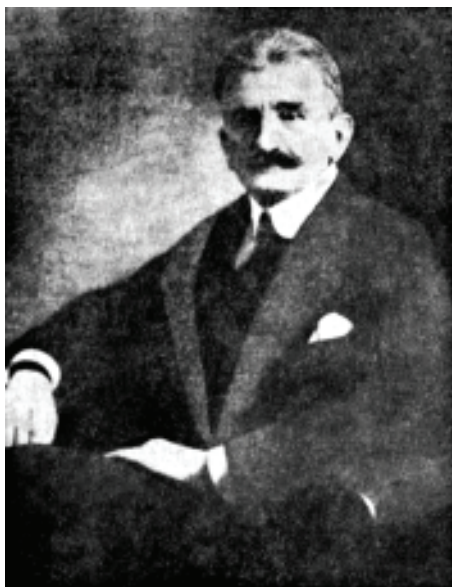
Диктатор ЗУНР Є. Петрушевич

Зовсім не сприяла заходам колишнього командира Січових стрільців і Варшавська угода про спільну боротьбу проти більшовицької Росії, укладена наприкінці квітня 1920 р. між польським та українським урядами. Згідно з положеннями угоди, уряд УНР визнав анексію Польщею Галичини й Західної Волині. Своєю чергою, Польща офіційно визнала незалежність УНР, а очолювану С. Петлюрою Директорію – верховною владою в Україні, зобов'язавшись надати їй військову підтримку у війні з більшовиками. Уже 25 квітня 1920 р. польські війська розгорнули наступ на окуповані терени Правобережної України, завдавши