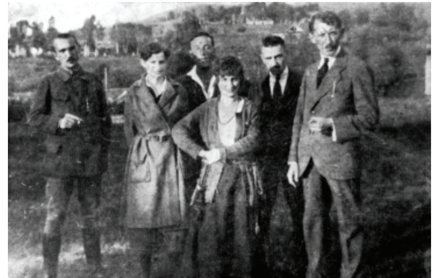
Є. Коновалець у горах. Ворохта, 1921 р.

Колишньому ж командирі Січових стрільців потрібна була лише можливість у разі успіху повстання розгорнути на Наддніпрянщині військову частину СС. Їхні цілі в чомусь збігалися. Невипадково вже невдовзі між Ю. Тютюнником та Є. Коновальцем зав'язуються контакти, безпосереднім ініціатором яких був полковник Ю. Отмарштайн, начальник штабу Тютюнника й водночас член січово-стрілецької комісії чотирьох. Як свідчив згодом оунівський історик З. Книш, Коновалець «відбував розмови з полк. Юрієм Отмарштайном, з отаманом Юрієм Тютюнником і його ад'ютантом Добротворським, зустрічався з ними в “Червоній Калині” та на інших конспіративних квартирах УВО у Львові. Більш як певне, темою цих розмов було поширення діяльності Української Військової Організації* на всю Україну» 175 .