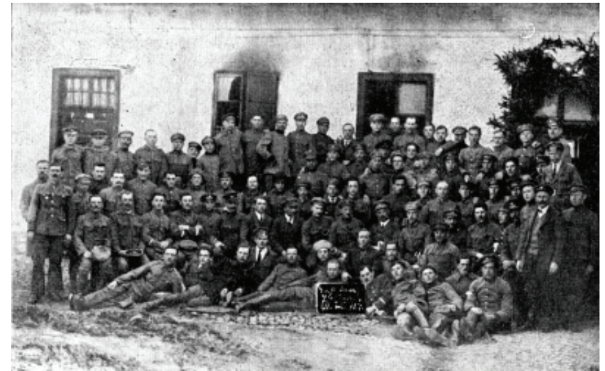
Робітнича сотня в Ужгороді. 1920 р.

Збереглися й спогади командувача більшовицької 1-ї Кінної армії С. Будьонного щодо пропозицій аналогічного змісту, котрі надійшли від деяких галицьких громад, давши підстави червоному командуванню розраховувати на створення для боротьби з поляками щонайменше двох галицьких дивізій 88 . Навіть диктатор ЗУНР Є. Петрушевич був схильний у цей час вважати, що більшовицька окупація Галичини відповідатиме інтересам краю, оскільки звільнить його від польської окупації 89 .