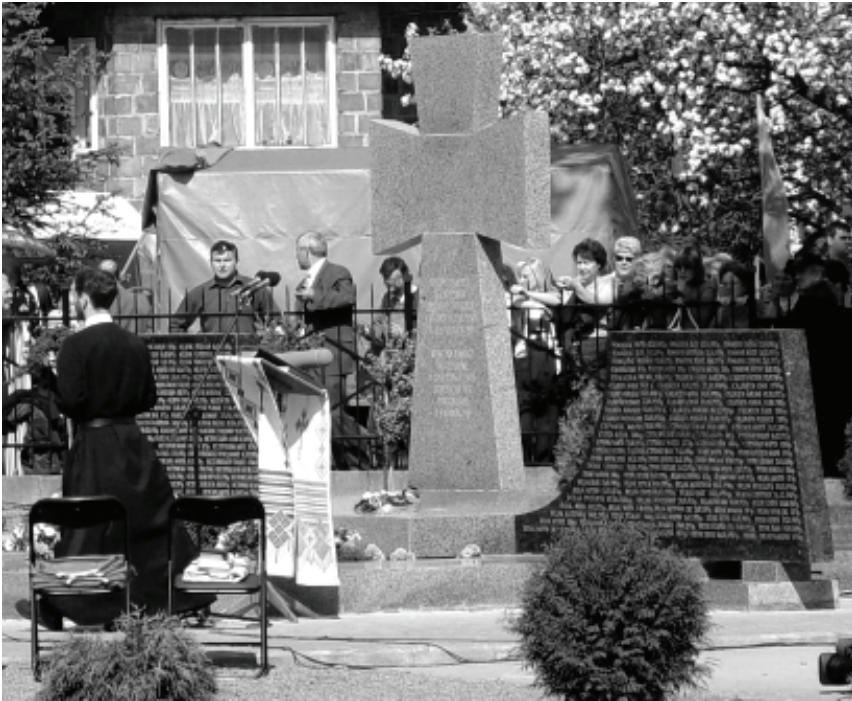
Меморіал загиблим українцям у с. Павлокомі

ської єпископської конференції РКЦ) дещо повторювала слова Блаженнішого Любомира, – він наголосив на примиренні як вияві сили, а не слабкості.