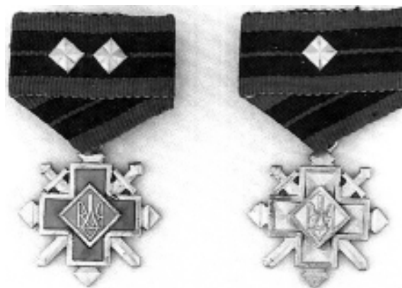
Фото 5. Хрести бойової заслуги УПА. Золотий хрест бойової заслуги 1-го класу помилково зображений з двома зірками-ромбами (перший зліва)

Далі ця помилка була повторена в першому в Україні ґрунтовному три-томному фалеристичному дослідженні «Нагороди України» (Київ, 1996). Тут вказано, що «знаки вищого класу того самого ступеня різнилися як кольоровим вирішенням, так і кількістю чотирикутних зірок на стрічці. Наприклад, знак Золотого хреста бойової заслуги 1-го класу від знаку Хреста 2-го класу відрізнявся тим, що поле хреста і ромба залите відповідно червоною та синьою емаллю, а крім того, наявністю двох золотих зірок на колодці. На стрічці Срібного хреста бойової заслуги 1-го класу розташовувалось дві срібні зірочки, а на стрічці 2-го класу – одна. Золотий хрест заслуги 1-го класу мав у центрі хреста золотий тризуб на синьому тлі та подвійний