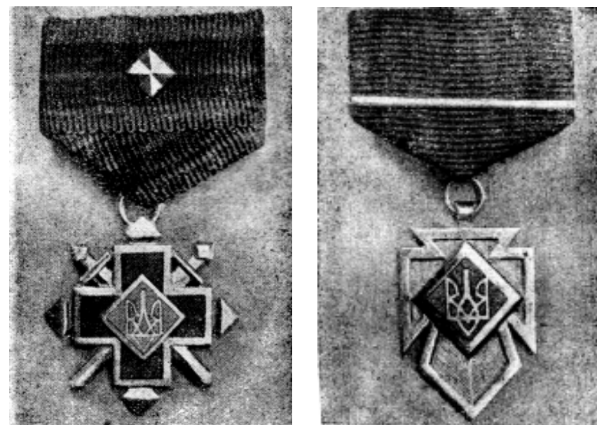
Фото 2. Найперше фотографічне зображення Золотого хреста бойової заслуги 1-го класу з однією зіркою-ромбом та Золотого хреста заслуг 1-го класу з одним паском

Найперше зображення бойових нагород УПА знаходимо в книжці П. Мірчука «Українська Повстанська Армія. 1942–1952» 11 (Мюнхен, 1953; фото 2). Тут ми чітко бачимо Золотий хрест бойової заслуги 1-го класу з однією зіркою-ромбом, а Золотий хрест заслуг 1-го класу – з одним паском, судячи з яскравого кольору на світлині – золотим. Також тут вперше подано зображення медалі «За боротьбу в особливо важких умовах». Отже, найперше фотографічне зображення бойових