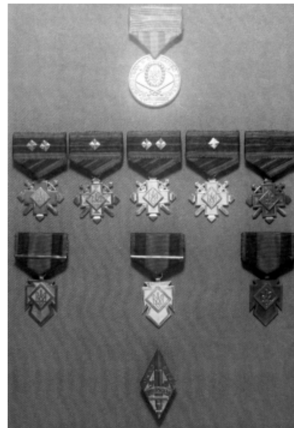
Фото 4. Кольорова вкладка до 9-го тому «Літопису УПА»