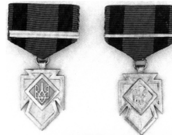
Фото 6. Хрести заслуги УПА. Золотий хрест заслуг 1-го класу помилково зображений з двома пасками (перший зліва)