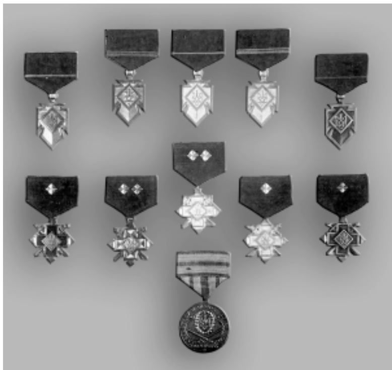
Фото 3. Комплект нагород УПА, вилучений у керівника підпілля Головного командира УПА Василя Кука – «Леміша»

«Ордени, медалі й відзначення» 13 подав дві світлини під назвою «Упівські відзначення», де зірки-ромби на стяжках теж відповідають поясненню Ніла Хасевича.