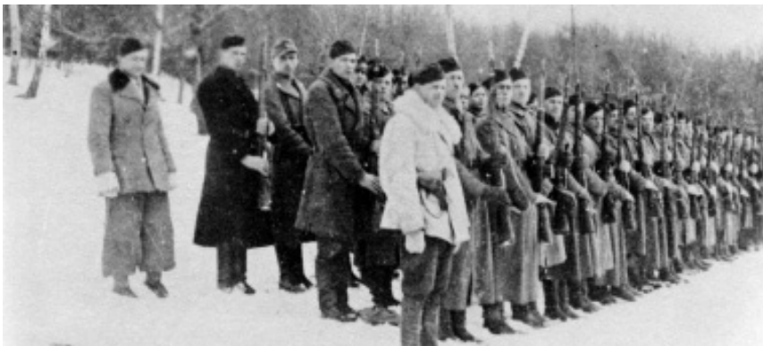
Фото 1. Невідома сотня Третьої ВО «Лисоня» готова до звіту (після команди «Почесть крісом дай!»). Зима 1943–1944 рр.