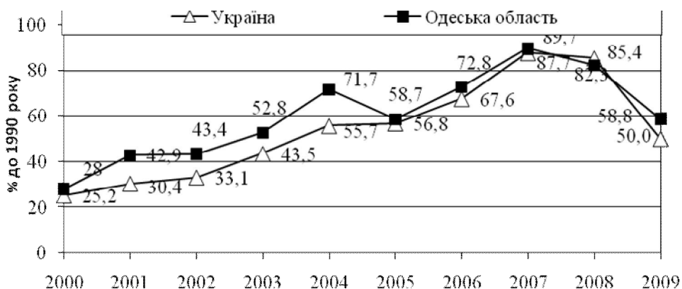
Рис. 2. Індекс інвестицій в основний капітал України та Одеської області у 2000-2009 рр.

в загальному обсязі інвестицій в основний капітал України у 2000-2009 рр. в середньому становила лише 4,5% [4].