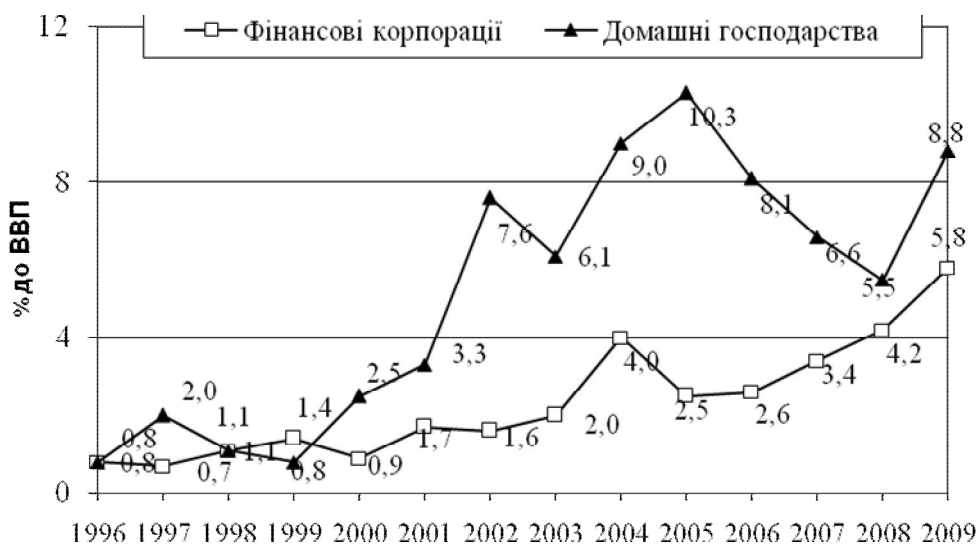
ис 5. Чисте заощадження у секторах фінансових корпорацій та домашнього господарства у 1996-2009 рр.

1. Приватизація в Україні не призвела до появи ефективних власників, відбувалася вона не в інтересах розвитку суспільства та економіки, а в інтересах окремих груп населення та приватних осіб, тісно пов'язаних з владою, у суспільстві панує думка, що процес приватизації великих підприємств був несправедливим, що обумовлює напругу у суспільстві та труднощі, щодо об'єднання зусиль різних верств населення на шляху економічного розвитку країни.