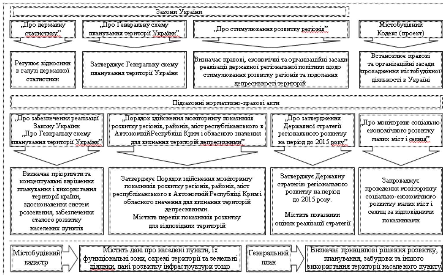
Рис. 1. Нормативно-правова база інформаційного забезпечення управління розвитком міста в Україні