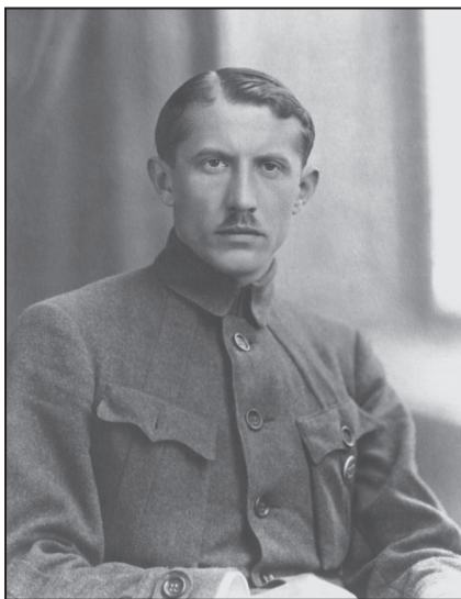
Є. Коновалець — полковник Корпусу Січових стрільців. Київ, 1919 р.

Першим виступив І. Лизанівський з доповіддю «Про політику галицьких українців в час війни та про останню угоду австрійської і польської буржуазії про прилучення українських земель до Поль-