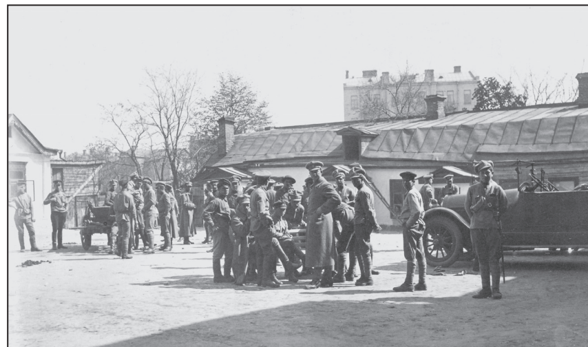
Подвір'я казарм Січових стрільців у Києві на вул. Львівській, 24. 30 квітня 1918 р.

щі» 5 . Потім виступали Т. Масарик, Є. Коновалець та С. Петлюра. Виступ останнього фактично став усною згодою на початок формування з військовополонених українців австро-угорського підданства куреня Січових стрільців. С. Петлюра наголосив на перспективах співпраці та обставинах, за яких Українська народна республіка (УНР) зможе стати на захист західноукраїнських земель: «...Що для того, щоб не допустити до насильства над частиною українського народу треба мати передовсім реальну силу. Я вірю — ... що Галичина і Буковина будуть приєднані до української республіки, як тільки в час заключення мирних переговорів Україна буде мати доволі збройних сил. А силу ту треба творити зараз і без зайвих слів... Від вас залежить теж успіх нашої роботи, а Генеральний Секретар подбає, щоб всіх полонених перевести на Україну» 6 .