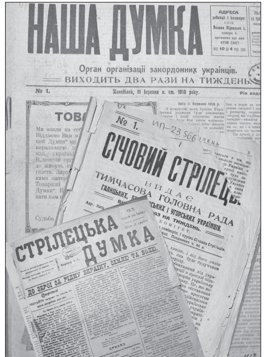
Часописи західноукраїнської громади Києва та Січових стрільців

Перші консультації щодо відновлення стрілецької формації розпочались вже в першій декаді травня 1918 р. Йдеться про Дми-