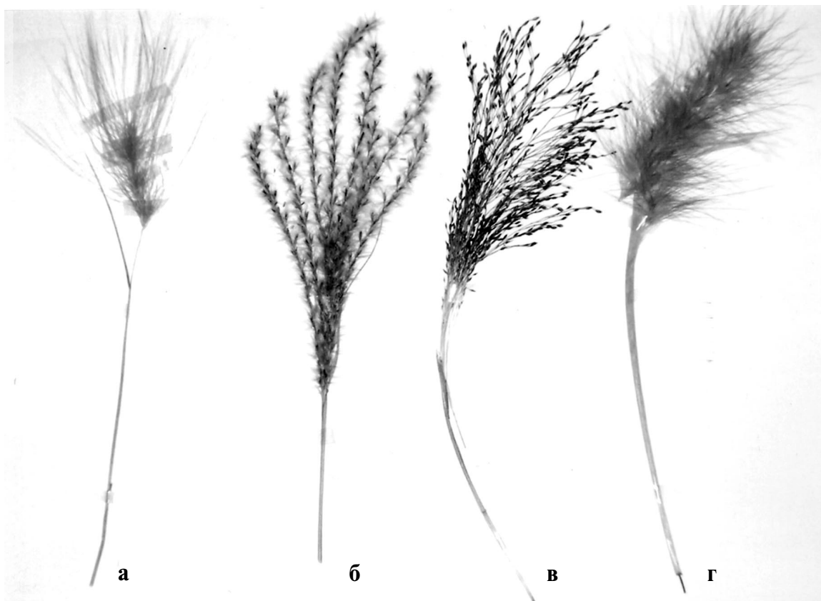
Рис. 2. Декоративные злаки. Соцветия: а) Hordeum jubatum ; б) Miscanthus sinensis в) Panicum capillar ; г) Pennisetum alopecuroides