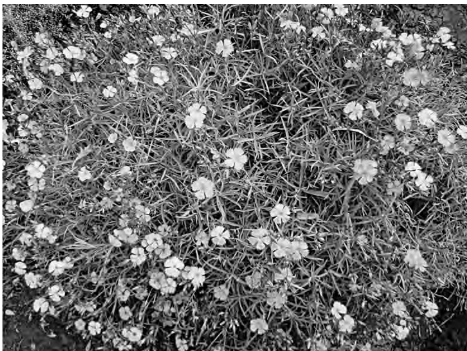
Рис. 2. Зрелое генеративное растение Dianthus seguieri Vill.

признаков относятся: обильность и продолжительность цветения, декоративные качества цветков, габитус, способность к семенному и вегетативному размножению, устойчивость к вредителям и болезням. При оценке каждого признака использовалась пятибалльная шкала и коэффициент значимости признака. Оценка перспективности, проведенная путем суммирования баллов по всем признакам, составила 90 баллов. Это означает, что D. seguieri относится к числу очень перспективных видов для введения в культуру на юго-востоке Украины.