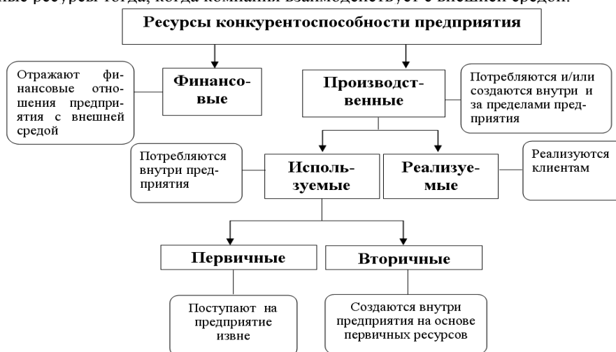
Рис. 1. Ресурсы конкурентоспособности предприятия.

Финансовые ресурсы формируются за счет внутренних (собственные и приравненные к ним средства) и внешних источников (мобилизуемые на финансовом рынке средства и денежные средства, поступающие в порядке перераспределения), образуя следующие группы ресурсов: собственные, заемные и привлеченные финансовые ресурсы. Их особенность в том, что они не могут быть использованы (потреблены) непосредственно внутри компании. Равно как и не могут быть созданы внутри компании. Используются и создаются данные ресурсы тогда, когда компания взаимодействует с внешней средой.