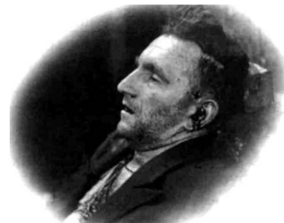
Посмертне фото Романа Шухевича

Політичні спекуляції довкола проблеми на тому не завершилися. У березні 2006 р., напередодні парламентських виборів, коло встановленого хреста відбувся великий мітинг, влаштований націонал-демократами. Місцева влада також активно намагається використати «збручанську» версію, щоб привернути увагу до себе. Так, Володимир Дольний, сільський голова Гукова, розташованого неподалік «віднайденного» місця, в одному з інтерв'ю стверджував, що місцеві жителі давно знали, де було спалено Романа Шухевича, але переховували цю таємницю. Нещодавно, на Покрови, тут знову відбувся величний мітинг із вшанування пам'яті загиблого командира УПА. Дуже добре, що героїв УПА вшановують за межами Західної України, сподіваємося незабаром це не буде дивиною для