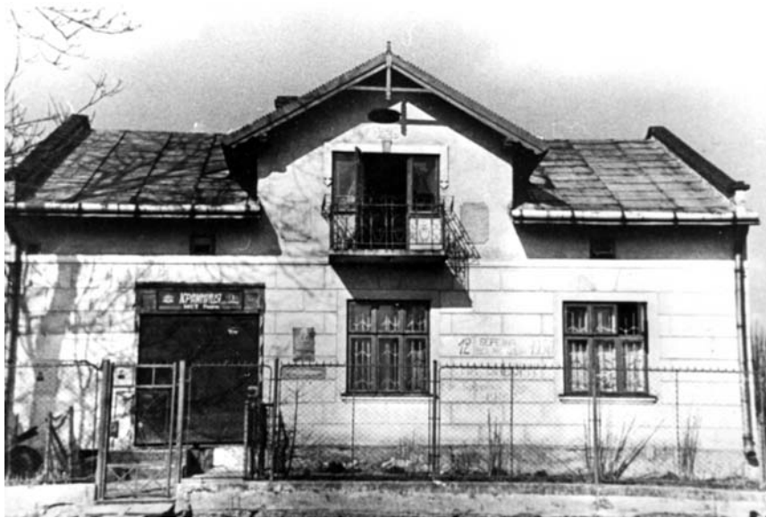
Будинок у с. Білогорща, місце загибелі Романа Шухевича (тепер музей)

наслідків Оранжевої революції, звернення Президента нашої держави В.А. Ющенко, держави, що вперше за свою 900-літню історію встає з колін і оновлюється, — подати один одному руку для загальнодержавного примирення, — я вирішив викласти свої думки в пресі» 20 . З подальших слів Гнапа з'ясуємо, що шукати місце захоронення останків Романа Шухевича він почав 1998 р. Ще до зустрічі з Болдіним йому вдалося дізнатися про те, що тіло було спалене за межами Західної України. Після цього Гнап розпочав пошук «конкретних виконавців цього акту вандалізму». Він зазначає, що перевіряв велику кількість архівних справ, опитав сотні свідків. Чомусь його активна пошукова діяльність залишилася непомітною для СБУ, котра здійснювала паралельні пошуки. В кінці 1999 р. від полковника І. К. Бабенка він дізнався про склад групи, яка проводила кремацію Шухевича. Слід нагадати: в розмові з працівниками СБУ в березні 2004 р. Бабенко твердив, що нічого про це не знає.